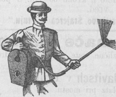
Zastopniki se iščejo!

Trijerji (čistilni stroji za žito) v natančni izvršitvi. Sušilnice za sadje in zelenjavo, škropilnice proti peronospori. Zboljšani sestav Vermorelov. Mehovi za žvepljanje trt. Mlatilnice, mlini za žito, stiskalnice (preše) za vino in sadje različnih sestav. Slamoreznice jako lahke za goniti in po zelo zmernih cenah. Stiskalnice za seno in slamo, ter vse potrebne, vsakovrstne poljedeljske stroje, prodaja v najboljši izvršitvi