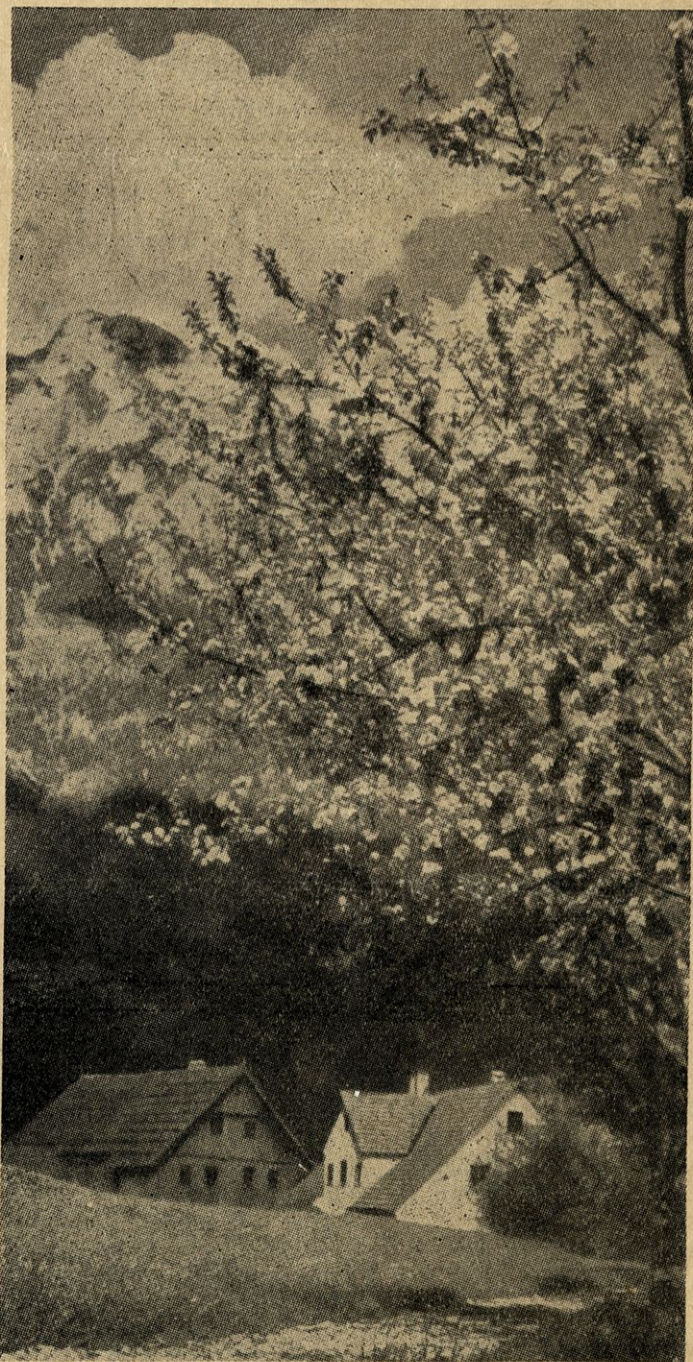
SPRING IN SLOVENIA ( NTH. JUGOSLAVIA )