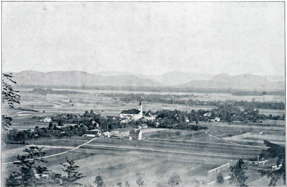
CERKLJE NA GORENJSKEM

A trajalo je dolgo, preden se je stvar uravnala. Na vrhuncu je bila vsa zadeva leta 1517. ter je raz-