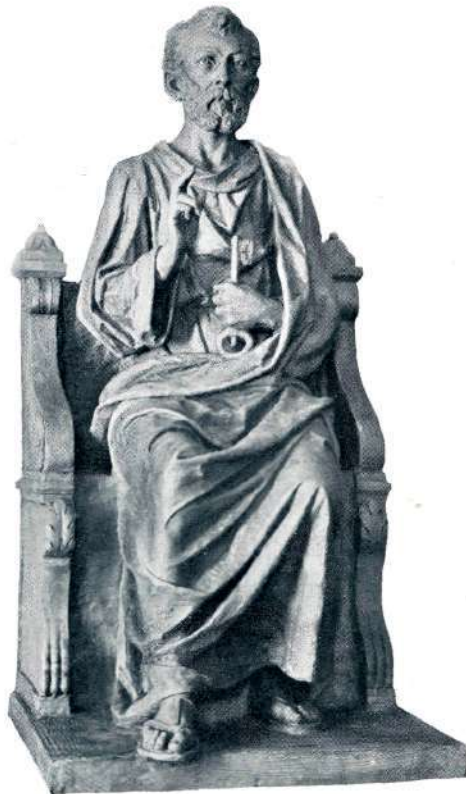
KIP AL. REPIČA SV. PETER

Tedenska maša naj se bere vsak ponedeljek „auf dem neuen Altar, so der offtgenannt herr Bischove in vnser lieben frauen abseiten von nem erpawen vnd in den Eren der heiligen martirer Nicephori, Primi vnd Feliciani selbs geweicht bey seiner begrebnus daselbs...“ Brati jo mora stolniški kaplan.