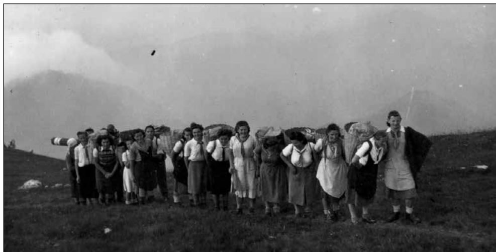
Nošnja gradbenega materiala na vrh Ratitovca.

In tako sta tako ratitovski zvon kot vpisna knjiga ostala v domači hiši. Ne vem sicer, kakšne načrte je ata z njima v tistih časih imel, a po onem sramotnem večernem obisku ju zagotovo ni nameraval izročiti nikomur več! Navsezadnje sta bila de iure in de facto njegova last!