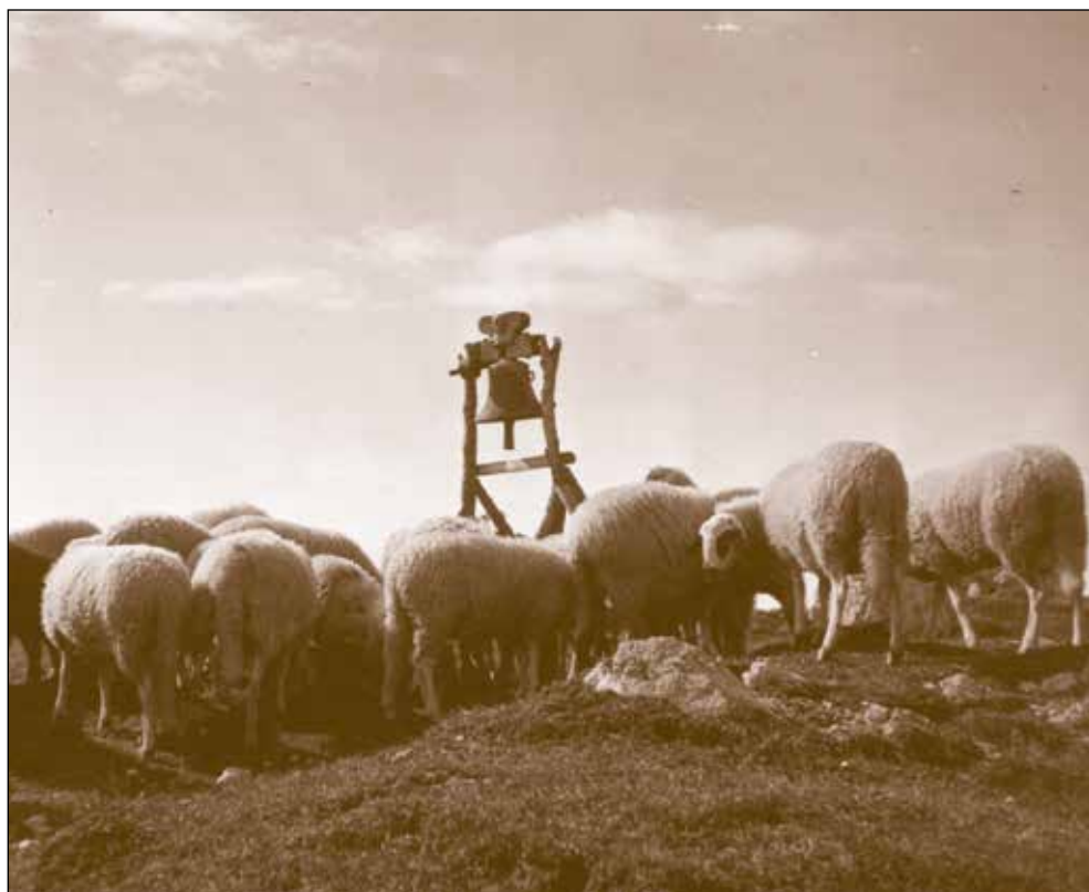
Zvon na Ratitovcu.