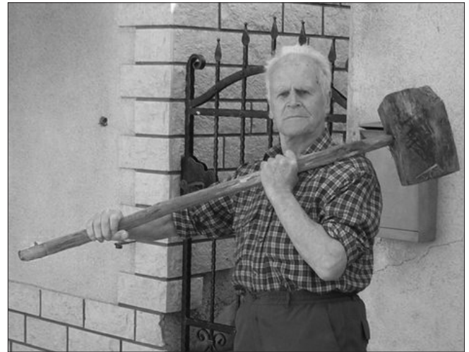
Lopatar z Matencom.

Orehovci so Korenjêvci. Vzdevek je pisno utemeljen. V knjigi iz predprejšnjega stoletja, kjer je podan ‚Zemljepisni in zgodovinski opis‘ Postojne in okolice in so jo »spisali in izdali učitelji v okraji«, o Orehku med drugim piše: »[...] prideluje se: pšenica, rež, oves, repa, poprejšnje čase mnogo korenja« (Postojnsko okrajno glavarstvo 2003: 42).