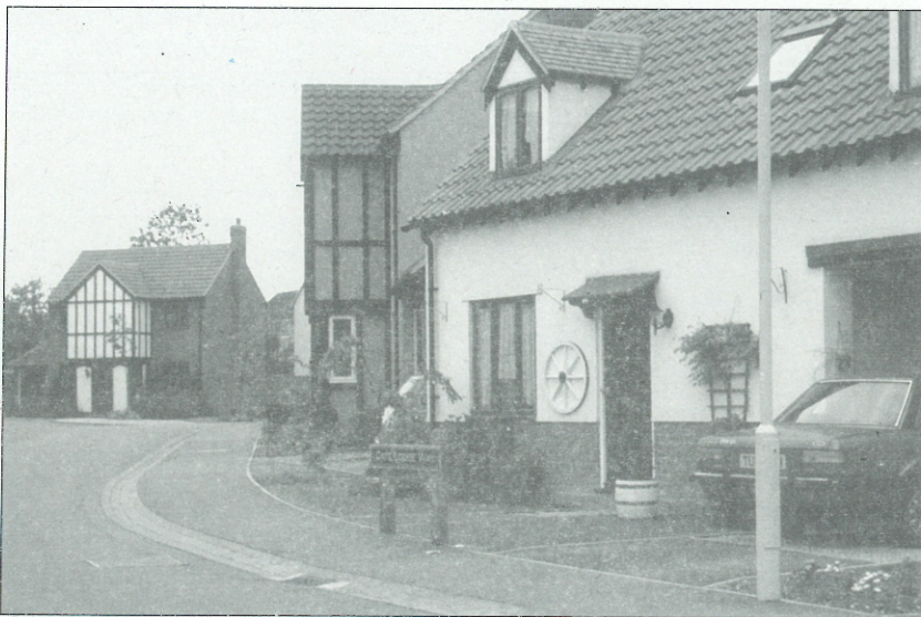
Slika 1: Vas Finchington v grofiji Essex

Gre za odnos med teorijo in prakso, iz katerega bi morali potegniti dobiček, kajti praksa brez teorije vodi v nesmiselno prevzemanje zunaj konteksta, teorija brez prakse pa je le akademsko igranje. Potreba po spravi med teorijo in prakso je nujna, če želimo preprečiti proizvodnjo "sprejemljive" povprečnosti ali pastiche arhitekture in urbanizma.