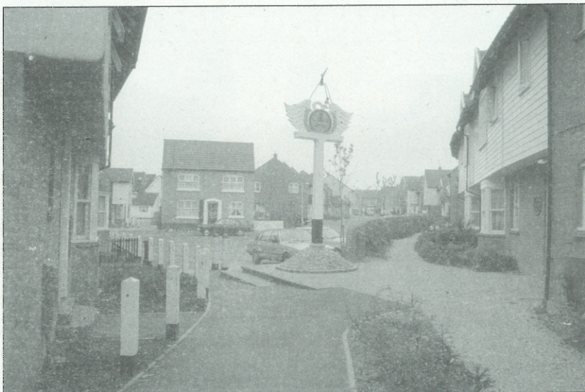
Slika 2 in 3: Vas Noake Bridge v grofiji Essex