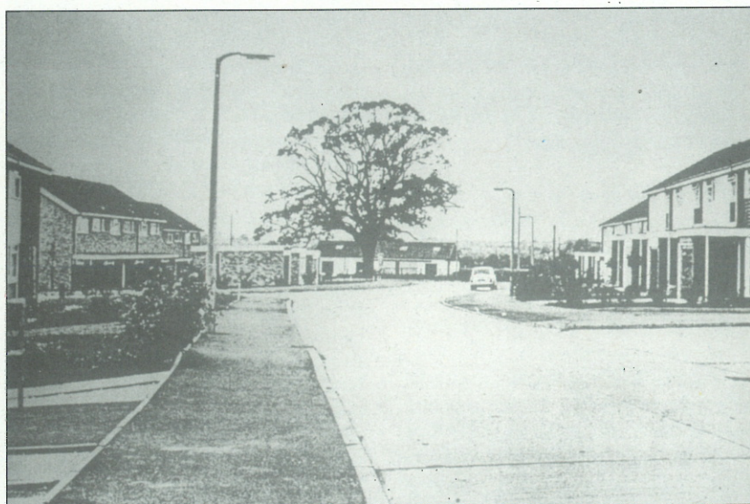
Slika 6: Tipična spekulativna zazidava za trg iz 60. let v grofiji Essex

Noake Bridge, Brentwood in South Woodham Ferres so značilni primeri naporov grofijskega sveta pri pospeševanju uporabe določenih regionalnih posebnosti v novih naseljih. Načela urbanističnega oblikovanja, ki sežejo od krajinskih dimenzij do elementov večjih ali manjših grajenih prostorov, kot so npr. tlorisi, gradiva, značilne skupine objektov, ornamentika in detajli, izvirajo iz sedanjih naselij v grofiji Essex. Upoštevanje priporočil iz "navodil" je bilo pogoj za pridobitev dovoljenja za gradnjo. "Nova identiteta" Essexja je danes splošno sprejeta med prebivalci, ki v njej vidijo uspešno zamenjavo prejšnjih spekulativnih stanovanjskih zazidav (za trg) ali nakupovalnih središč z oznako "kjerkoli".