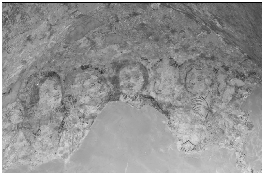
Kristus z apostoli, prezbiterij podružnične cerkve sv. Device Marije na Kamnu pri Vuzenici, zadnja četrtina 14. stoletja.

domačimi slikarji, ki so novosti v oblikovanju figuralnih tipov, modeliranju obraza in oblačilih spajali s tradicionalnimi oblikami ter tvorili t. i. "mešani" ali hibridni slog. Pionirski primer tovrstnega slikarstva v Vzhodni Sloveniji najdemo okoli leta 1370 v poslikavi prezbiterija v podružnične cerkve sv. Neže na Brdinjah.