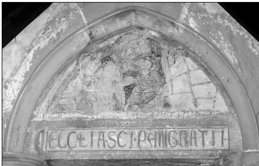
Devica Marija z detetom, luneta portala podružnične cerkve sv. Pankracija v Starem trgu pri Slovenj Gradcu, sredina 14. stoletja.