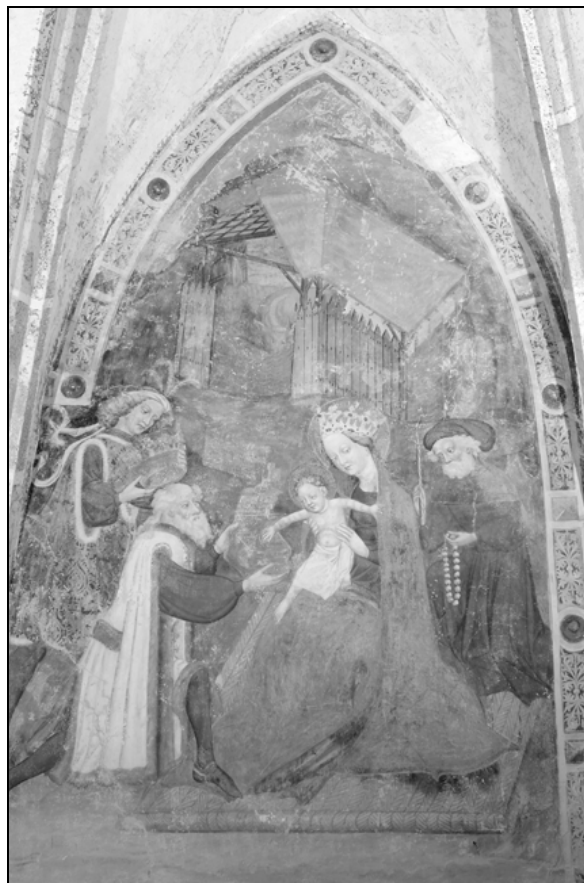
Poklon sv. Treh kraljev, podružnična cerkev sv. Janeza Krstnika, Šentjanž nad Dravčami, 1440–1445.

njekoroške delavnice, ne najdemo primerjave v severovzhodnem delu Slovenije, lahko pa jo navežemo na dva spomenika prek meje, in sicer: poslikavo v cerkvi sv. Jurija v Gornji vasi nad Žvabekom (Oberdorf bei Schwabegg) in na poslikavo severne stene Marijine cerkve v Dobrli vasi, 17 ki jih na šentjanski spomenik veže obrazna tipika ženskih figur in potiskani negativni lukeški tekstilni vzorec, ki ga v rahlih odstopanjih najdemo na draperiji vseh treh poslikav. 18 Poslikava južne stene, posvečena prizorom iz legende cerkvenega patrona, z upodobitvijo votivne podobe naročnikov pod zadnjim prizorom, glede na poslikave severne kaže slogovno diferenco, zato se sklepa, da je poslikava delo dveh različnih mojstrov. Pohod in poklon sv. Treh kraljev je delo kvalitetnejšega mojstra ter odraža vplive beljaškega kroga ter mednarodnega gotskega sloga, medtem ko je svetniška legenda na južni steni delo konservativnejšega mojstra pod vplivom starejše trecentistične tradicije.