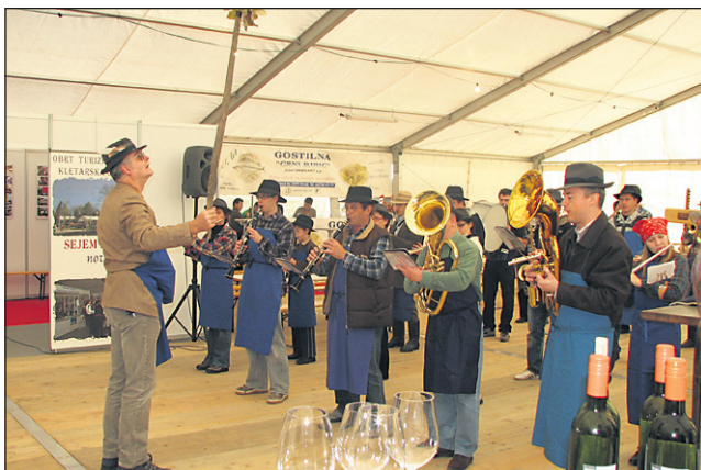
Med številnimi nastopajočimi je prireditvi dajala ton tudi ormoška godba, ki je bila za to priložnost prav po goričko pripravljena.

dnost, manjša harmonija zaradi izstopajočega sladkorja, ki se je tepel z višjo kislino,