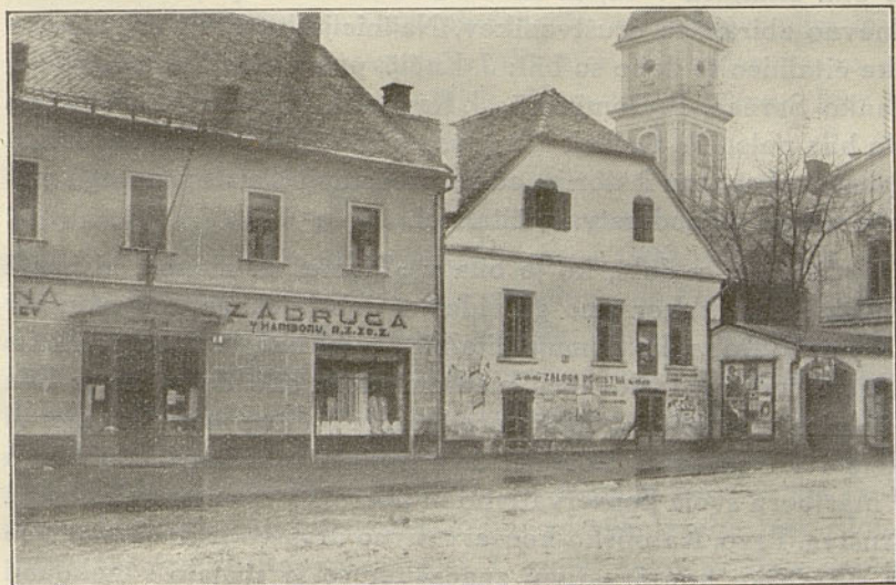
Nekdanja »Pivnica pri moki«, pozneje Rotovški trg šte. 3.

Bližina rotovža in mestne župnijske cerkve ter sejmišče na Rotovškem in Slomšekovem trgu so prometno lego predela med Slomšekovim in Rotovškim trgom še stopnjevali, tako da najdemo v prvi polovici XIX. stoletja poleg Glavnega trga in obdravskih predelov baš tu najbolj cvetoče obrti starega Mari-bora.