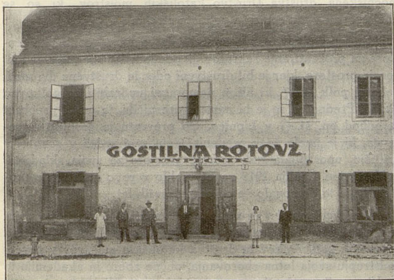
Nekdanja »Pivnica«, pozneje Rotovski trg štev. 2.

Prostore bivše kavarne je zasedlo Katoliško društvo rokodelskih pomočnikov. V Pivnici si je društvo takoj nabavilo nov moderen gledališki oder, lastnik hiše, Čeligi, pa je novemu najemniku preskrbel biljard, ki je bil v tistih letih v Mariboru še redek. V zvezi z gledališkim odrom se je vršilo v hiši vse no-