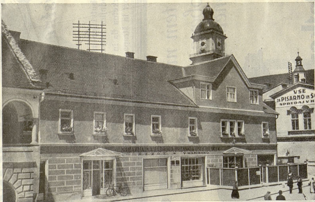
Zadrugi dom Nabavljalne zadruge državnih uslužbencev v Mariboru (Rotovski trg 2 — Telefon 21-35)