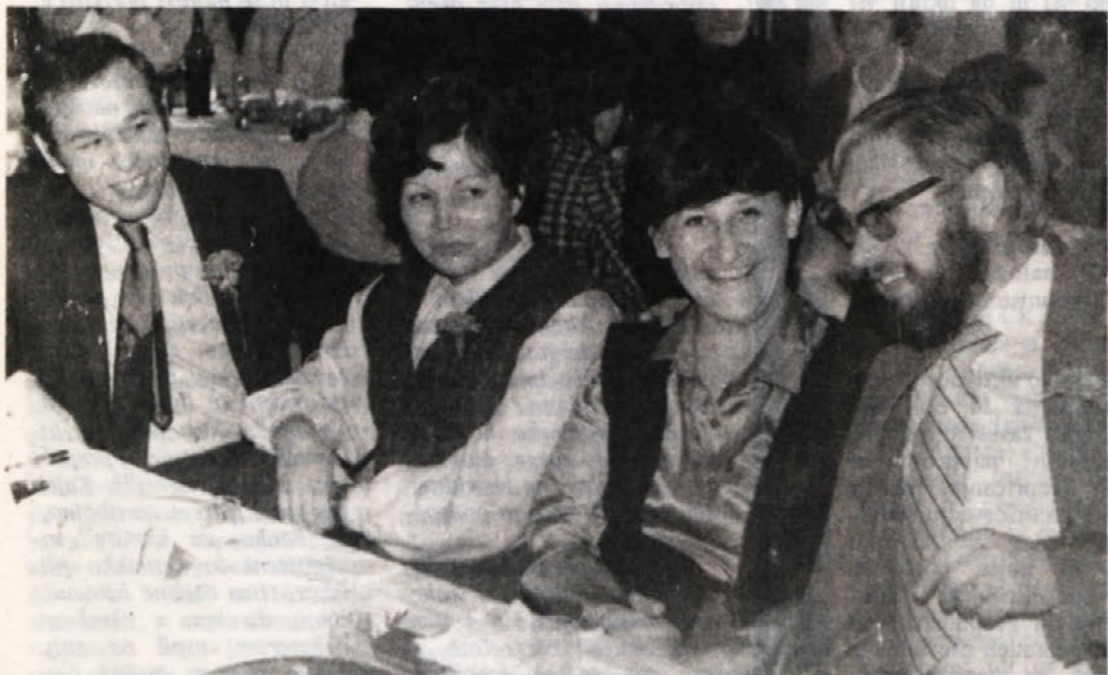
PESEM, PLES – Tako veselo je bilo v Beti, ko so se zbrali v menzi jubilaranti dela. Vrstile so se šale, plesali smo in peli. Marsikdo je razvezal svojo dušo, marsikdo se je nasmejaj od srca. Včasih se je le treba sprostiti.