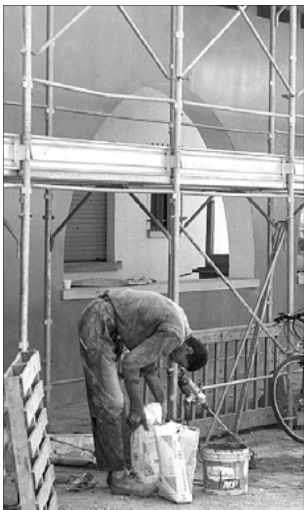
Včerajšnji videz gradbišča v Sovodnjah

Usoda stavbe rupenskega vrtca bo odvisna od geološke študije, ki jo bo opravil izvedenec