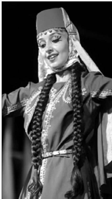
Folklorna v Gorici

Jutrišnji program, ravno tako z začetkom ob 20.30, bodo uvedli Danzerini di Lucinico, nakar se bodo na odru zvrstile skupine Kum Dance iz Južne Koreje, Cuniburo Cultural iz Ekvadorja n Gorets iz Vladikavkaza v Severni Osetiji. Bogat bo sobotni program: po plesu skupine Caprivese ob 20.30 bodo nastopili vsi letošnji gostje, ob že omenjenih še Gruppo sbandieratori San Gemini iz Italije in glasbena skupina Africa Chioosana iz Senegala. Ob 23.30 bo občinstvo izbiralo dobitnika nagrade za simpatijo - Trofeje goriškega gradu, žirija pa dobitnike nagrade Tullio Tentori in oskarjev folklorne. Opolnoči bo sledil praznik prijateljstva. V primeru dežja se bo dogajanje selilo v dvorano UGG, skupine pa bodo med potekom festivala pozabavale tudi varovance združenja Cuore Amico ter domov za ostarele Culot in Villa San Giusto. Nedeljski sprevid vseh skupin se bo začel ob 16.30 na Trgu Sv. Antona.