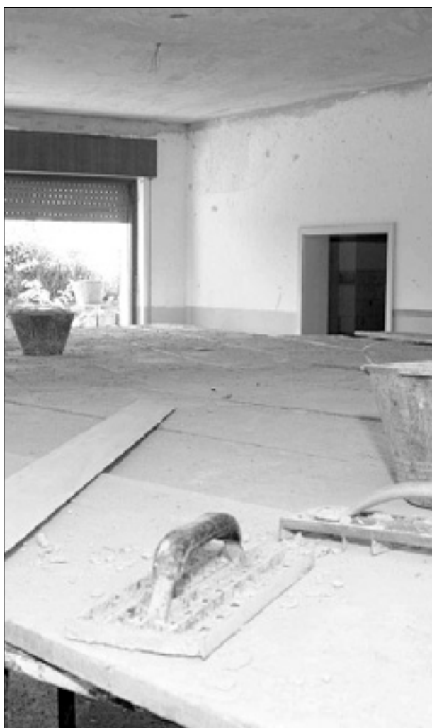
Prostore morajo še prepleškati in urediti