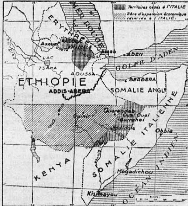
Zemljevid »nove« Abesinije

Angleži imajo zaradi svojega nastopa proti Italiji zvezane roke v Sredozemskem morju, v Afriki in tudi v Evropi. To so prav dobro opazili Japonci in porabili priložnost za nov sunek na Kitajsko. Na Kitajskem imajo pa Angleži velike interese. Interesi se dajo braniti le z orožjem, to se pravi, z vojnimi ladjami. Vojne ladje je pa treba od