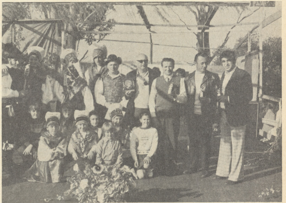
Nastopajoča mladina na očetovski proslavi v Horsley Parku — Sydney 7.9.75.

Ta napis je poživil naš oder na prostem, v nedeljo 7. septembra, na slovenski zemlji v Horsley Parku, ko smo na piknik in proslavo povabili naše slovenske očete. Želeli smo jim pripraviti, res lep piknik in še lepšo proslavo. Že pri vohu na našo zemljo sta dve smejoči se dekleti stali v narodnih nošah, ter očetom pripenjali rdeče nageljne, jim čestitali za praznik ter zaželeli prijetno popoldne med nami.