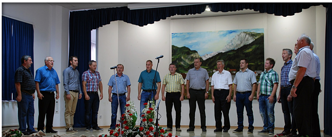
Pevci Kulturno umetniškega društva Raduha Luče med nastopom v domači dvorani

Ker se tovrstna srečanja pripravljajo na tristopenjski ravni (območni, regijski in državni), so le-ta tudi strokovno spremljana.