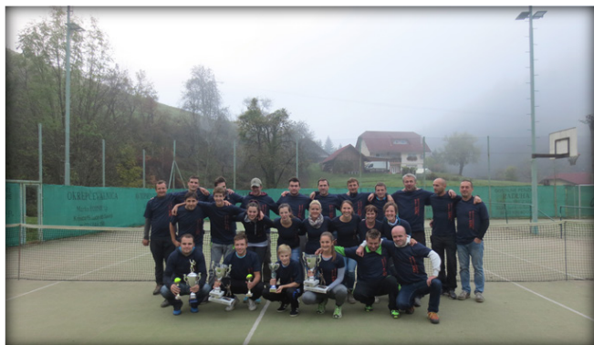
Udeleženci zaključnega turnirja