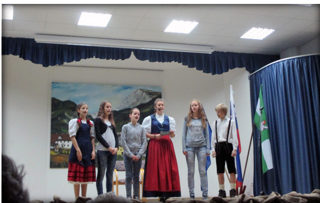
Učenci OŠ so pripravili pester kulturni program