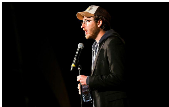
Med nastopom na festivalu Panč