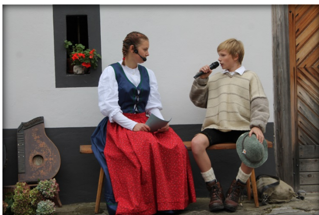
Kulturni program pred Juvanovo hišo

Učenci in učitelji ter otroci iz vrta OŠ Blaža Arničiča so letos sodelovali tretjič, prireditvi pa so dali naslov Drobci dediščine domačega kraja.