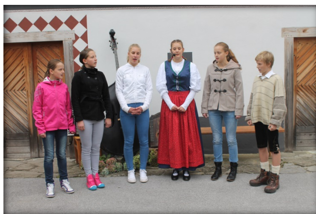
Skriti cvet v izvedbi sexteta učencev

sprehod po vasi in se fotografirali na ganku, pred starimi vhodnimi vrati, na vozu ... Učenci od 4. do 6. razreda so risali in slikali stare predmete in detajle na hišah (vhodna vrata, likalniki, lahterne, kavni mlinčki), sedmošolci so risali Žagerski mlin v Podvolovljeku, osmošolci so se poskusili v