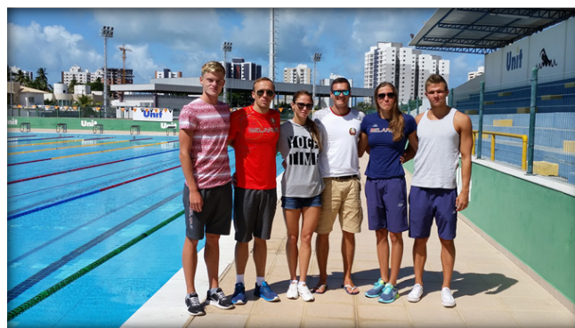
Na zadnjih pripravah z belorusko reprezentanco