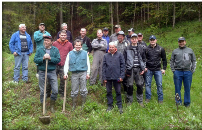
Urejanje okolice in priprava terena za vzrejno postajo