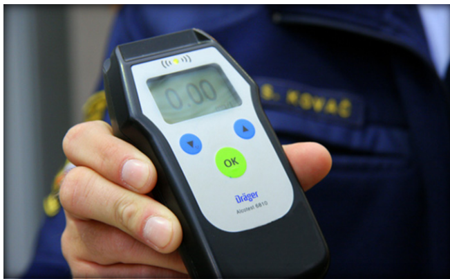
Vozniki z velikimi koncentracijami alkohola so izjemno nevarni

Ker se zima že počasi približuje, bi radi opozorili na uporabo predpisane zimske opreme na vozilih. Zakon o pravilih cestnega prometa (Uradni list RS, št. 109/2010 z dne 30. 12. 2010 s spremembami in dopolnitvami) v 29. členu določa, da morajo biti motorna in priklopna vozila na slovenskih cestah pozimi (med 15. novembrom in 15. marcem naslednjega leta) in v zimskih razmerah (ko se ob sneženju sneg oprijema vozišča ali je vozišče zasneženo, zaledenelo (ledena ploskev) ali poledenelo (poledica)), opremljena s predpisano zimsko opremo. Zimsko opremo motornih vozil določa Pravilnik o delih in opremi vozil (Uradni list RS, št. 44/2013).