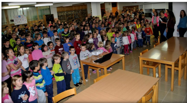
Priljubljena pesem Lojzeta Slaka »Čebelar« je odmevala na 450 šolah po Sloveniji