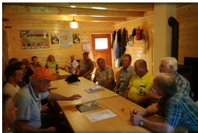
Srečanje na temo vzreje čebeljih matic

Dogodka so se udeležili predstavniki ČZ SAŠA (plemenilna postaja Lučka Bela), predstavnika koroških čebelarjev iz Slovenj Gradca (plemenilna postaja Legen), predstavnik gorenjskih čebelarjev (plemenilna postaja Zelenica) in delegacija iz Železne Kaple (plemenilna postaja Kočna). Nekateri od njih so pri svojem delu do sedaj pridobili že veliko izkušenj, ki bi jih lahko uvedli tudi na ostale plemenilne postaje. Prav tako je odprta možnost sodelovanja pri izmenjavi genskega materiala in s tem izboljšanja kakovosti čebeljih družin.