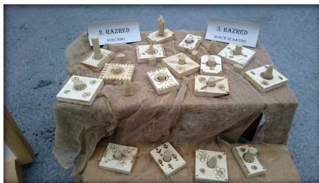
Razstava izdelkov, ki so nastali med raziskovanjem učencev

predstavil z Arničevo pesmijo April, sekstet učencev s pesmijo Skriti cvet, ki jo je ustvaril Gričarjev Tonče, nastop pa so popestrile še peričice iz vrta in prave perice iz 7. razreda, ki so dokazale, da poleg pranja in petja dobro poznajo tudi »vaške čenče«.