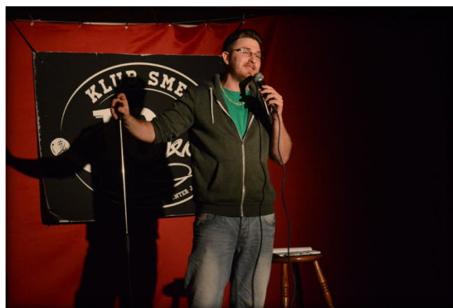
V stand-up klubu 10ka

Stand-up je moja primarna dejavnost, a bi zelo rad delal tudi oddaje. Ne bi se rad omejeval na Slovenijo, verjamem, da se da prodreti tudi izven naših meja. Treba se je