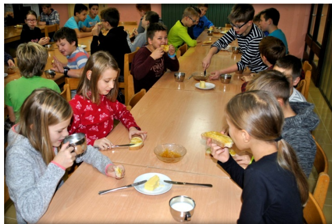
Okusen zajtrk za dober začetek dneva

Letošnje leto pa je bil 18. november glasbeno nadgrajen. Čebelarska zveza Slovenije je dala pobudo, da bi ob 10. uri po vsej Sloveniji zapeli Slakovo pesem Čebelar. Več kot 30.000 glasov je štel pevski zbor, ki je ob 10.00 prepeval in med njimi so bili tudi vsi lučki šolarji, otroci iz vrtca ter zaposleni.