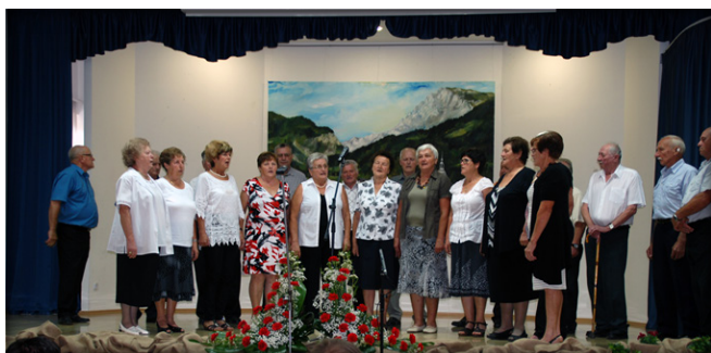
Pevke in pevci ljudskega izročila Društva upokojencev Luče

Prvo nedeljo v mesecu septembru se je v dvorani gasilskega doma v Lučah odvijalo območno srečanje pevcev ljudskih pesmi in godcev ljudskih viž, ki ga, tako kot vsako leto, pripravlja Javni sklad RS za kulturne dejavnosti OI Mozirje, letos ob pomoči Kulturno-umetniškega društva Raduha Luče.