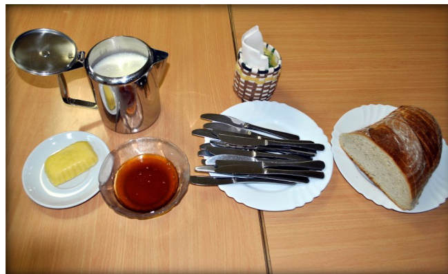
Projekt prispeva k ozaveščanju o pomenu domače pridelave in zdravega načina prehranjevanja