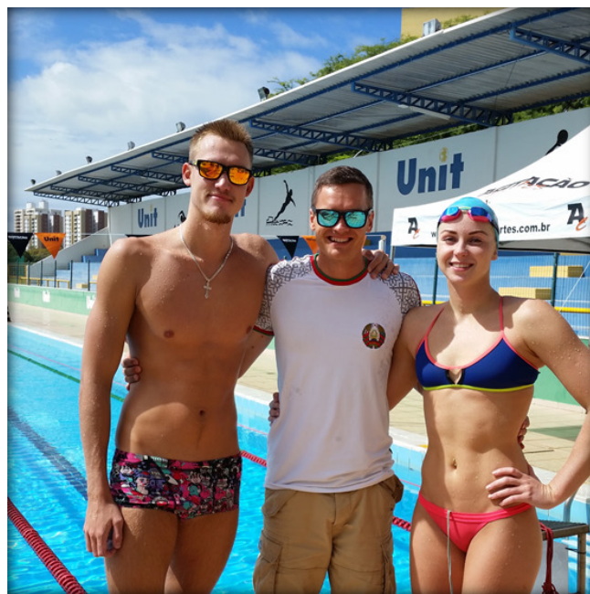
S kazahstanskima plavalcema pred odhodom v Rio