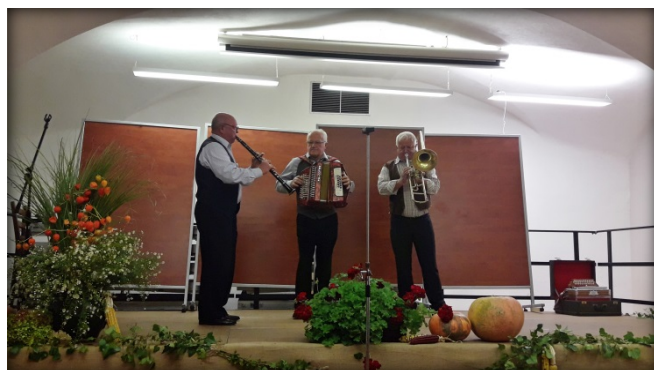
Ljudski godci Društva upokojencev Luče

predstavijo na regijskih srečanjih, nastopa ni mogoče zagotoviti vsem.