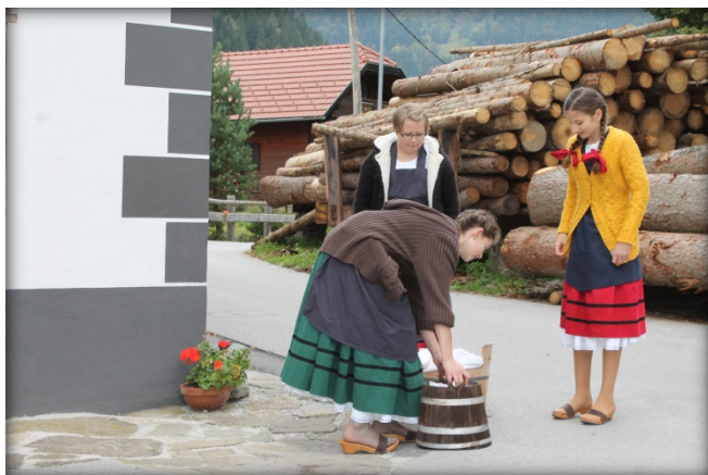
Perice so si težko delo popestrile s pripovedovanjem vaških čenč