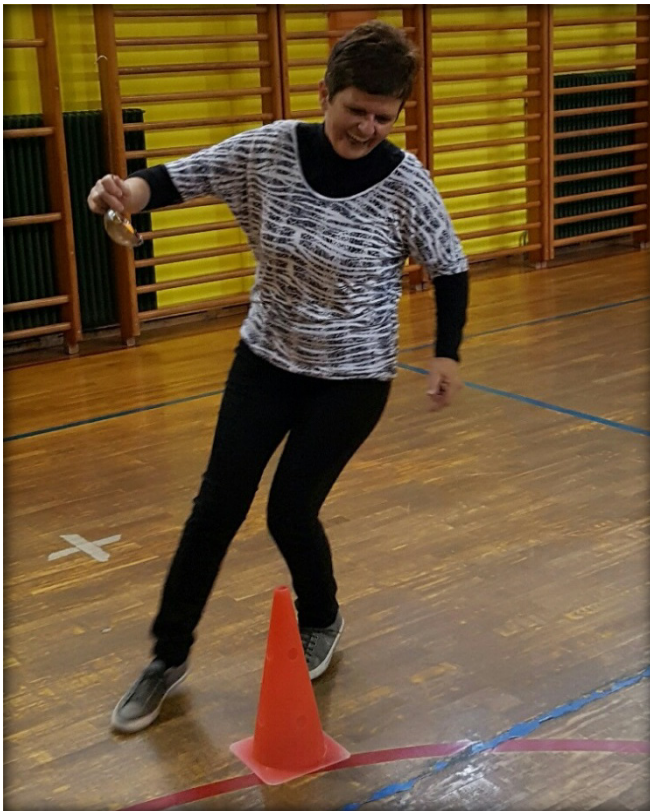
Zabavno medgeneracijsko druženje

Od 10. do 16. oktobra 2016 je po vsej Sloveniji potekal projekt Simbioza giba, čigar pokrovitelji so Ministrstvo za zdravje, Nacionalni inštitut za javno zdravje, Zveza društev upokojencev Slovenije, Fakulteta za šport Univerze v Ljubljani, Olimpijski komite Slovenije ter Zavarovalnica Triglav. Namen projekta je gibanje, rekreacija ter šport za vse generacije. V tem tednu po vsej Sloveniji potekajo različne brezplačne športne aktivnosti, ki bi naj povezovale različne generacije.