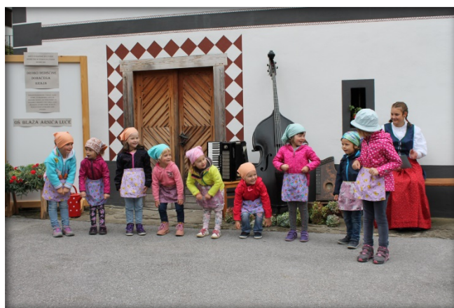
Najmlajše peričice iz vrta