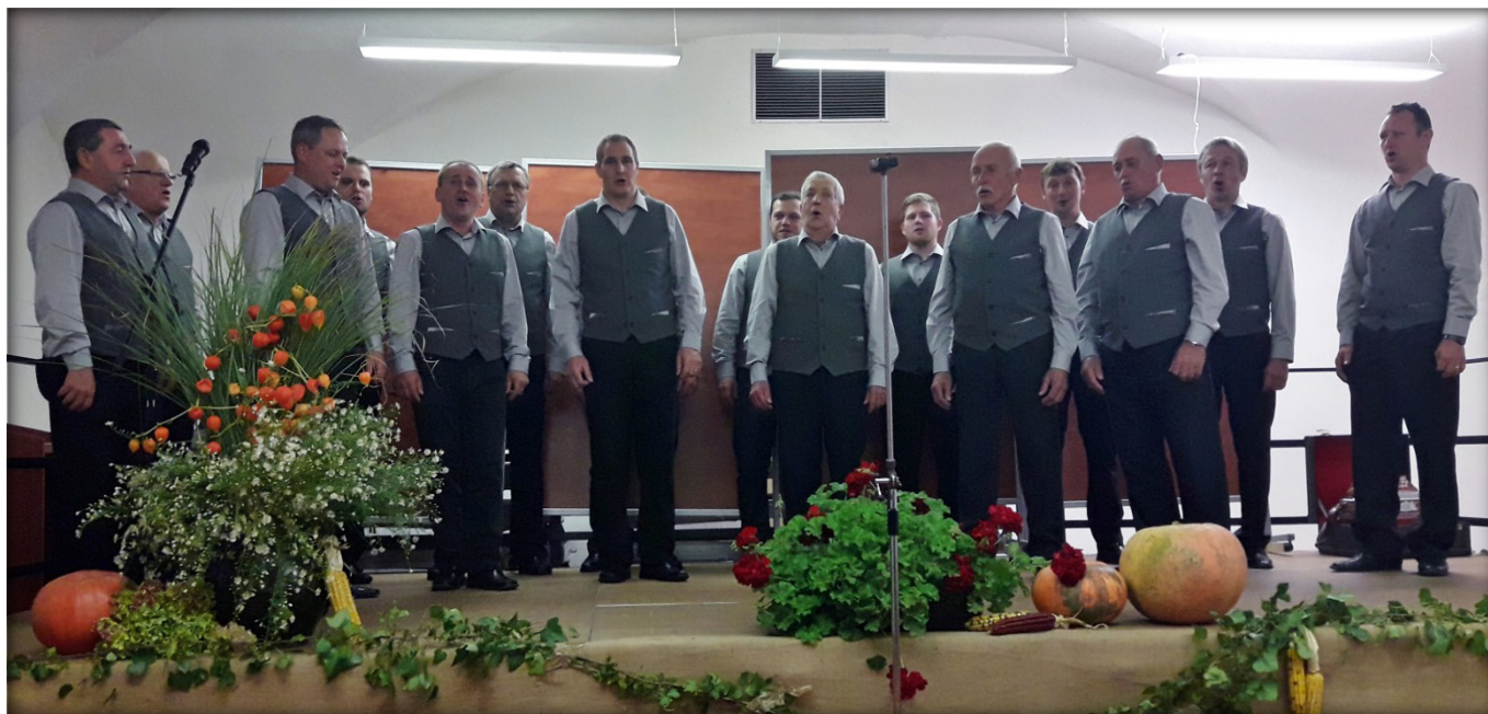
Lučki pevci na državni prireditvi v Šmartnem pri Litiji

Strokovni spremljevalci na podlagi dogovorjenih meril izberejo manjše število nastopajočih za regijsko srečanje, nato pa po istih načelih še skupine za državno srečanje.