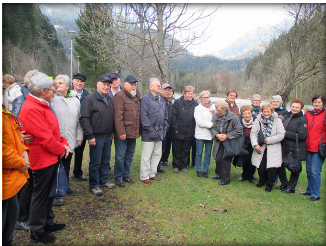
Na sprehodu ob bistri Savinji

Zgornjesavinjski diabetiki smo praznovali svetovni dan sladkorne bolezni v Lučah, kjer smo med prijaznimi domačini preživeli zelo prijeten dan.