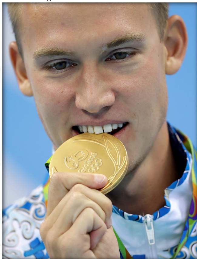
Dimitrij Balandin je Kazahstancem priplaval zlato olimpijsko odličje

različnih koncih sveta, vidiš druge kulture in navade, razširijo se ti obzorja, spremeniš miselnost. To so življenjske izkušnje, zgodbe za vnučke, nekaj, česar morda nekdo drug ne bo nikoli doživel.