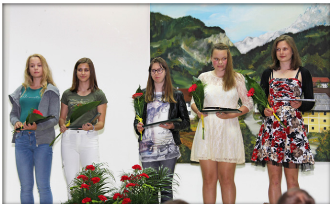
Najboljše učenke so prejele »Županovo petico«

Spremljajoči del programa so oblikovali učenci Osnovne šole Blaža Arniča Luče in ostali mladi Lučani, za glasbeno noto so poskrbeli člani Okteta Žetev in moškega pevskega zbora Kulturno umetniškega društva Raduha Luče, letošnje občinske nagrajence pa je podrobneje predstavila predsednica KUD Raduha Luče.