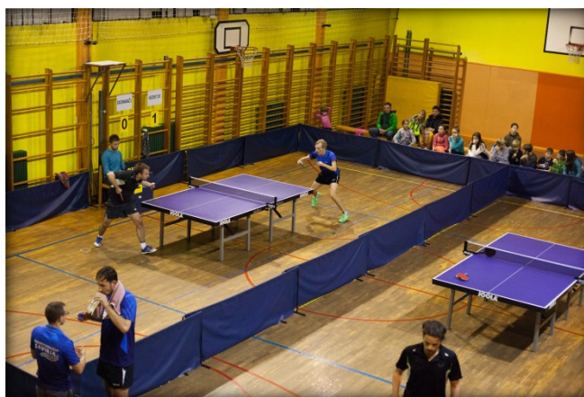
Eden od napetih dvobojev v lučki telovadnici