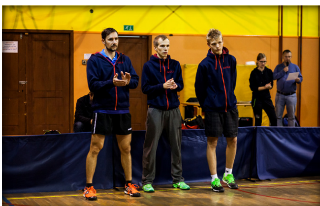
Ekipa NTK Savinja pred ligaško tekmo proti ekipi NTK Logatec