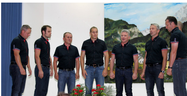
Kulturni program so pripravili člani KUD Raduha

Zbrane je uvodoma nagovoril župan, ki je hkrati predstavil tudi pomembnejše dosežke v tekočem letu v lokalni skupnosti in v nadaljevanju slovesno podelil občinska priznanja letošnjim občinskim nagrajencem. Letos so bila prvič v okviru občinskega praznika podeljena tudi posebna priznanja »Županova petica« za najuspešnejše učence devetega razreda.