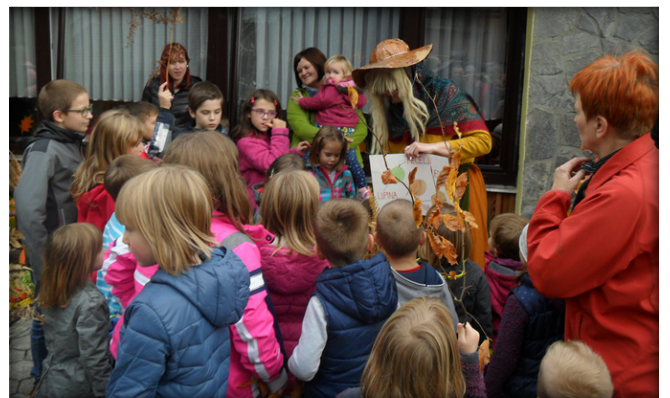
Tetka Jesen na obisku pri najmlajših