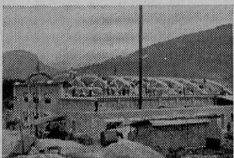
Prvi začetki izgradnje Tovarne »Tomaž Godec«