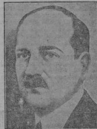
Francoski finančni minister Flandin, o kojega položaju poročamo pod zaglavjem »Politika«.