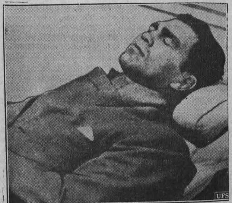
Max Schmeling, Nemški boksar se je vrnil v domovino in se je, kot vidno, na ladji počeno oddahnil od borbe z zamorcem Joe Louisom.