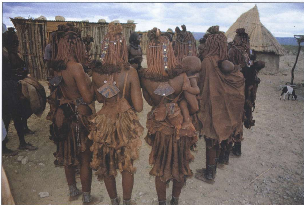
Slika 1: Člani ljudstva Himba si kožo in v kite spletene lase premažejo z rdečo ilovico.

žičk, dekleta pa poleg tega še ogrlico, na kateri je obešena morska školjka. Lepota in bogastvo ogrlice sta odvisna od družbenega statusa družine, ki ji deček ali deklica pripada. Vsekakor pa stvar ni poceni, saj so prenekateri samo školjko pribarantali za ceno ene krave.