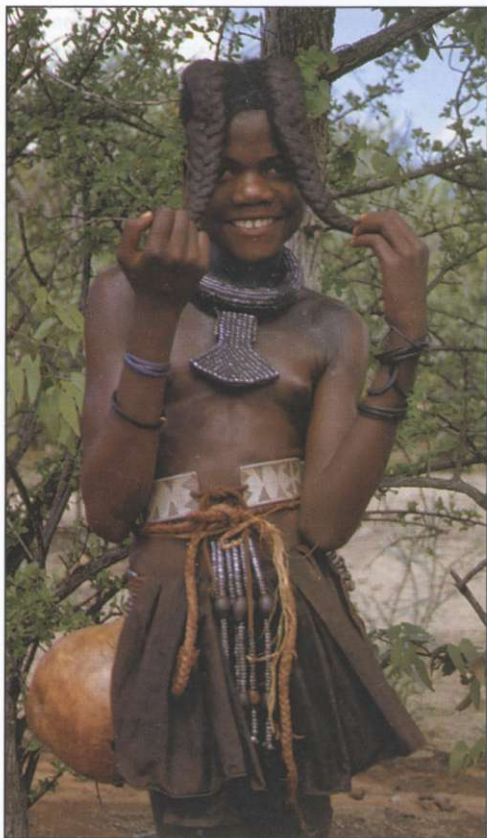
Slika 5: Nedorasli fantje in dekleta imajo kite počesane naprej, dorasle ženske pa nazaj.

sama počasi izumrla, prodala se bo za sladkor, tobak in alkohol.