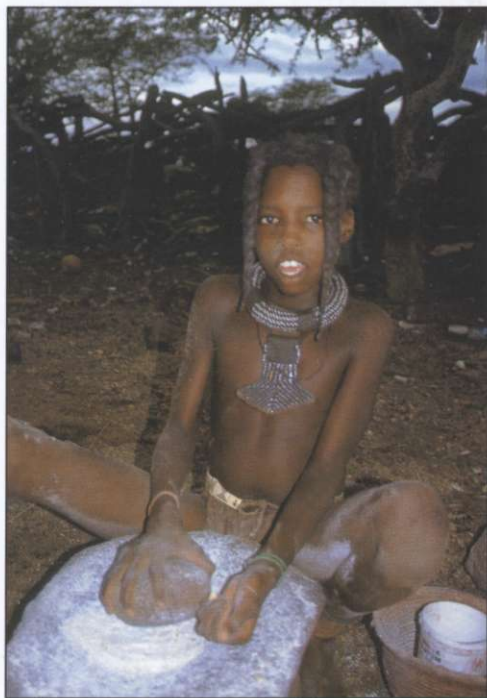
Slika 5: Himba pri drobljenju zrnja, v ozadju ograda, ki obkroža kraal.

Noseča ženska se ni pustila slikati. Verjela je namreč, da bi lahko to škodovalo plodu. Deklica, ki smo jo srečali na poti, je ob pogledu na bele obraze pobegnila v goščavo. Njena prijateljica je kasneje izjavila, da jo je bilo tako strah zato, ker smo bili brez barve. Srečali smo tudi dečka, ki je med največjo vročino koračil v debelem črnem dežnem plašču. Našel ga je neznan kje, pomenil pa mu je preveč, da bi ga slekel v še tako pripekajočem soncu. Morda mu bo prinesel srečo, njemu in ljudstvu Himbe.