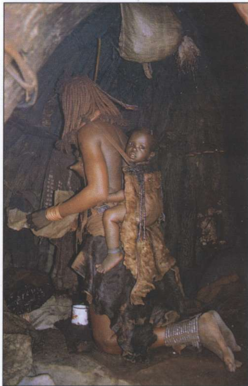
Slika 4: Mati z dojenčkom med vsakodnevnimi opravili v notranjosti kočice.

Medtem pa sredi domačega kraala ves čas sedi ostareli moški, bolšči v večno goreči ogenj in nalaga nanj. Od ognja se nikdar ne odmakne, ženska pa k ognju nikdar ne pristopi. Čeprav je vera v duhove prednikov med črnci močno razširjena, je duhovna povezava med živimi in že umrlimi predniki redkokoli tako močno izražena kot pri Himbah in njihovih običajih, povezanih z ritualnim ognjem, ki ga ima po sveti dolžnosti v vsakem kraalu pravico in