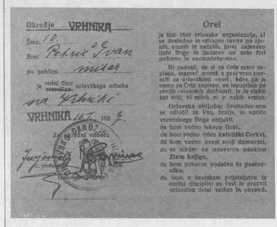
Orlovska članska izkaznica za leto 1927

krožku, ki je bil najbolj aktiven. Urnika so se držali le pred pomembnejšimi prireditvami. Od 1926. pa tudi nastopi in tekmovanja niso več motivirali članov, da bi hodili na vaje. Odsek se je znašel v velikih težavah in je bil velikokrat prisiljen prestaviti in celo odpovedati prireditve, na katerih bi morali sodelovati. Niti 4. vseslovanski orlovski shod v Pragi, od 28. junija do 7. julija 1929, ni bil dovolj, da bi se stanje popravilo. 5. junija 1929 so sklenili, da bodo šli v Prago v vsakem primeru. 51 Rzsodišče je velikokrat obravnavalo posamezne člane, jih opozarjalo na napake in mnoge celo izključilo, vendar brez večjega uspeha. Mnogi člani so kljub temu še vedno "obrekovali in osirali", 52 drugi so bili prizadeti. Brat Janko je odboru napisal pismo, v katerem se vidi vsa njegova užaljenost in prizadetost, ker so ga črtali iz članstva. 53