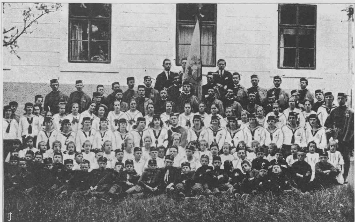
Orlovska družina Vrhnika, 13. maja 1926

deklaracije, ustanovitve Jugoslavije, preboja Solunske fronte, Rappalske pogodbe, materinskega dneva. Udeleževali so se okrožnih, srenjskih in odsekovnih prireditev oziroma tekmovanj, akademij in se vračali domov z diplomami in priznanji. 9. marca 1924 je odsek priredil veliko telovadno akademijo s programom, na kateri so nastopali le člani. To je bila hkrati priprava na okrožno tekmo 11. maja 1924, kjer je odsek dobil veliko diplomo. Nastopili so tudi člani nižjega oddelka, ki so postali najboljši v vrhniškem okrožju. 45 Zelo ponosni so bili na sodelovanje svojih članov leta 1926, 1927 in 1928 na stadionu v Ljubljani. Leto 1927 je bilo zelo pomembno "saj bo štiri dni pred njihovem nastopom sokolski nastop, ki ga je treba prekrositi". 46