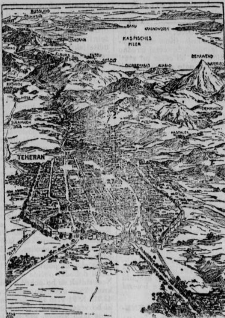
Pogled na sporno perzijsko ozemlje s tiče perspektive.

+ Izrebane deželne obveznice. Da- nes so se pri deželnem odboru od 4 % deželnega posojila izrebele sledeče ob- veznice, in sicer: à 20.000 K: 46, 99, 92; à 10.000 K: 4, 69, 59; à 2000 K: 1656, 46, 366, 155, 1059, 224, 1987, 501, 2095, 1374,