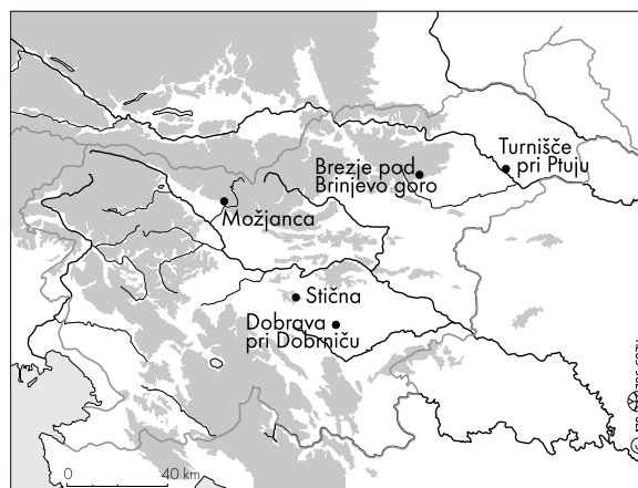
Sl. 4: Najdišča igel s preluknjanim vratom v Sloveniji.

starejše stopnje južnoalpske veje srednjeevropske kulture grobnih gomil. 6 Poleg Možjanca so igle s preluknjanim vratom znane še iz Brezij pod Brinjevo goro, 7 z Brinjeve gore, 8 iz okolice Stične (sl. 3: 4), 9 iz Dobrave pri Dobrniču (sl. 3: 3) 10 in iz Turnišča pri Ptuj. 11 Diskasta glavnica, ki bi lahko bila del igle s preluknjanim vratom, je bila najdena tudi na Velikem Korinju. 12