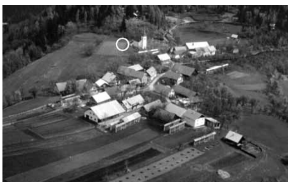
Sl. 1: Možjanca. Pogled na vas s cerkvijo sv. Miklavža in njivo ob njej, na kateri sta bili najdeni igli.

1. Bronasta igla. Glavica je okrogla, nizko stožčasta. Vrat igle je raven, okroglega preseka. Rahlo odebeljeni del vratu