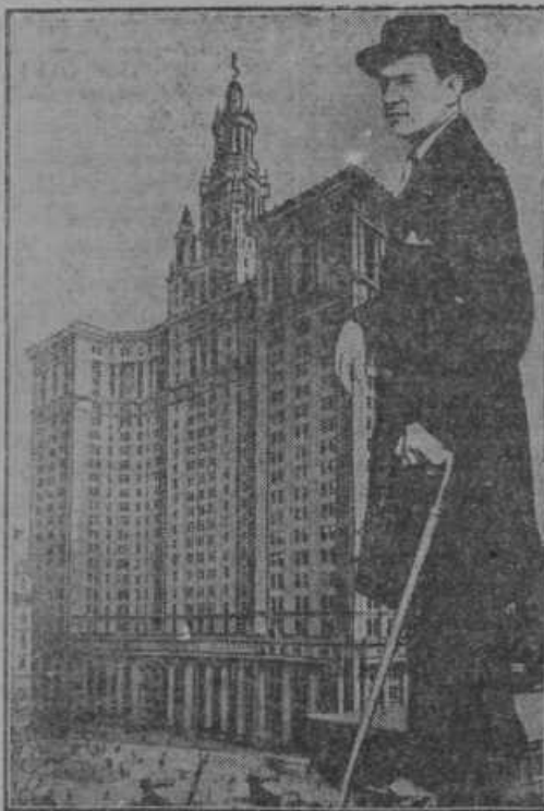
Rotovž in župan velemesta Newyork — Jimmy Walker.

Zimski kmetijski tečaj priredi letos v smislu tozadevnega razpisa kr. banske uprave srezko načelstvo za celjski srez v Gomilskem. Tozadevna predavanja iz vseh panog kmetijstva in raznih drugih panog našega narodnega gospodarstva se vrše v času od 31. januarja do 6. marca redno vsako nedeljo od 9. ure naprej v prostorih osnovne šole v Gomilskem. Predavali bodo sami naši priznani strokovnjaki. Nekatera predavanja bodo spremljale po možnosti tudi žive kinoslike. Kmetijska izobrazba je v času sedanje težke krize posebno važna in potrebna ter se zato kmetovalci iz Gomilskega in okolice izrecno opozarjajo na ta tečaj, da se v lastnem interesu predavanja udeležujejo redno, stari in mladi, moški in ženske, v čim obilnejšem številu.