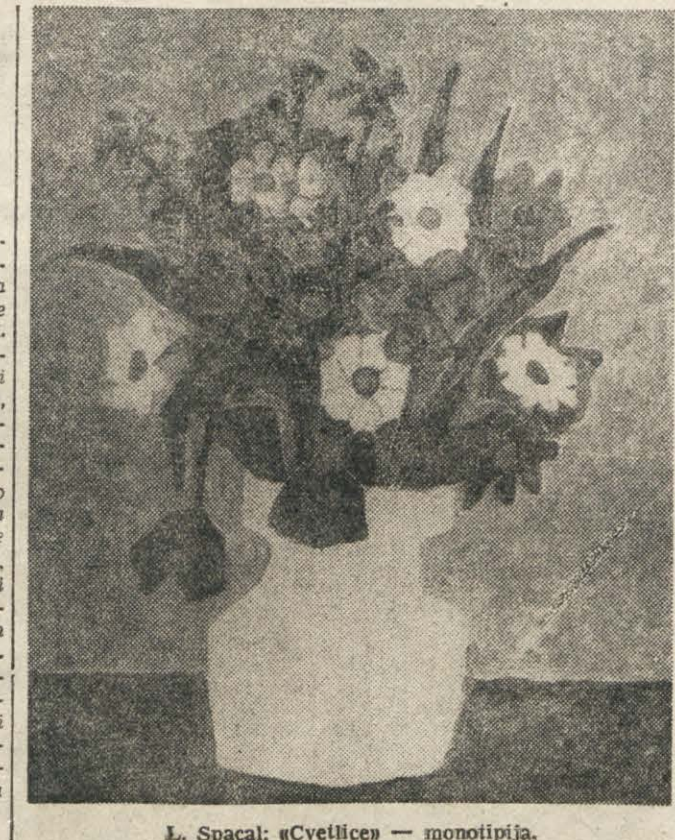
L. Spacal: 'Cvetlice' — monotipija.