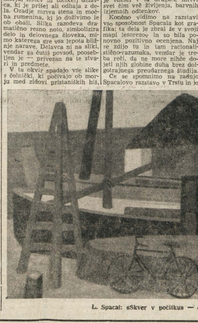
L. Spacal: 'Skver v počitku' — oje.