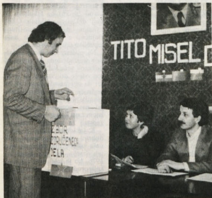
USPEH NI IZOSTAL – Volitve v zbor združenega dela in delegaciji v samoupravne interesne skupnosti so za nami. V delovni organizaciji Beti so bile odlično pripravljene, zato tudi uspeh ni izostal.

Teško je v tem trenutku predvideti vse posledice, ki jih bo prinesel načrtovani zakon o usmerjenem izobraževanju, ki bo nadomeščal sedanja zakona o srednjem šolstvu, o poklicnem izobraževanju in urejanju razmerij, zakon o organizacijah in izobraževanju odraslih in zakon o visokem šolstvu. Omenjeni zakon ne bo nov zakon o šolstvu, ampak popolnoma nov način izobraževanja, saj bo opredelil temeljne smeri izobraževanja (izobraževanje za poklic, izobraževanje iz dela in z delom in izpopolnjevanje v poklicu). Ta povsem nova kvaliteta, ki pojmuje izobraževanje izključno kot usposabljanje za delo (fizično ali umsko), kjer šola ne bo več odtrgana od proizvodnje, ampak bosta njen razvoj in tudi morebitno širjenje njene dejavnosti vezana prav na širjenje družbeno-ekonomске osnove, pa nalaga poleg pravic, ki jih bodo dobili delavci, tudi veliko obveznosti.