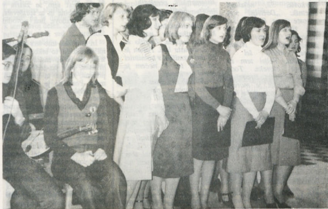
„KAKOVOSTEN“ 8. MAREC – Za osmi marec, dan žena, samo imeli proslavo v menzi. V kulturnem programu so nastopili tamburaši mladinskega kluba ter učenke poklicne šole, ki so pele in recitirale. Program je bil kvaliteten, škoda le, da niso bili urejeni tudi prevozi.