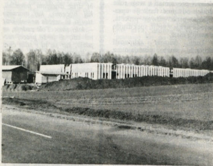
DO MAJA NAMREČ — Delo pri graditvi naše stavbe v Žakanju lepo napreduje. Transportno gradbeno podjetje zagotavlja, da bodo dela končana v roku, to se pravi do maja. Ljudje se že zanimajo za zaposlitev, okrog novogradnje pa je prodanih tudi že več parcel za gradnjo hiš.