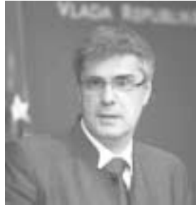
Minister Dorjan Marušič

Zadnji poskus v smeri uvedbe nezdržljivosti sega v leto 2009, ko je vlada pripravila predlog zakona o integriteti, ki je sprva predvideval uvedbo nezdržljivosti, a so se pozneje v koaliciji dogovorili, da bodo to področje uredili v zakonu o poslancih. Tako so vodje koalicijskih poslanskih skupin tedaj predlagali novelo zakona o poslancih, ki je predvidevala uvedbo nezdržljivosti z naslednjimi parlamentarnimi volitvami.