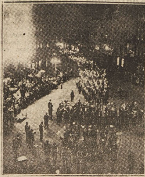
Procesija mož in fantov z bakljami v soboto zvečer pred magistratou