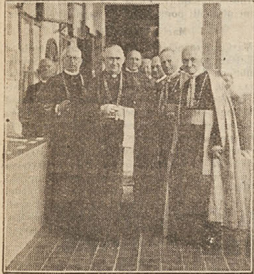
Dostojanstveniki na razstavi cerkvene umetnosti