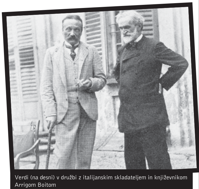
Verdi (na desni) v družbi z italijanskim skladateljem in književnikom Arrigom Boitom