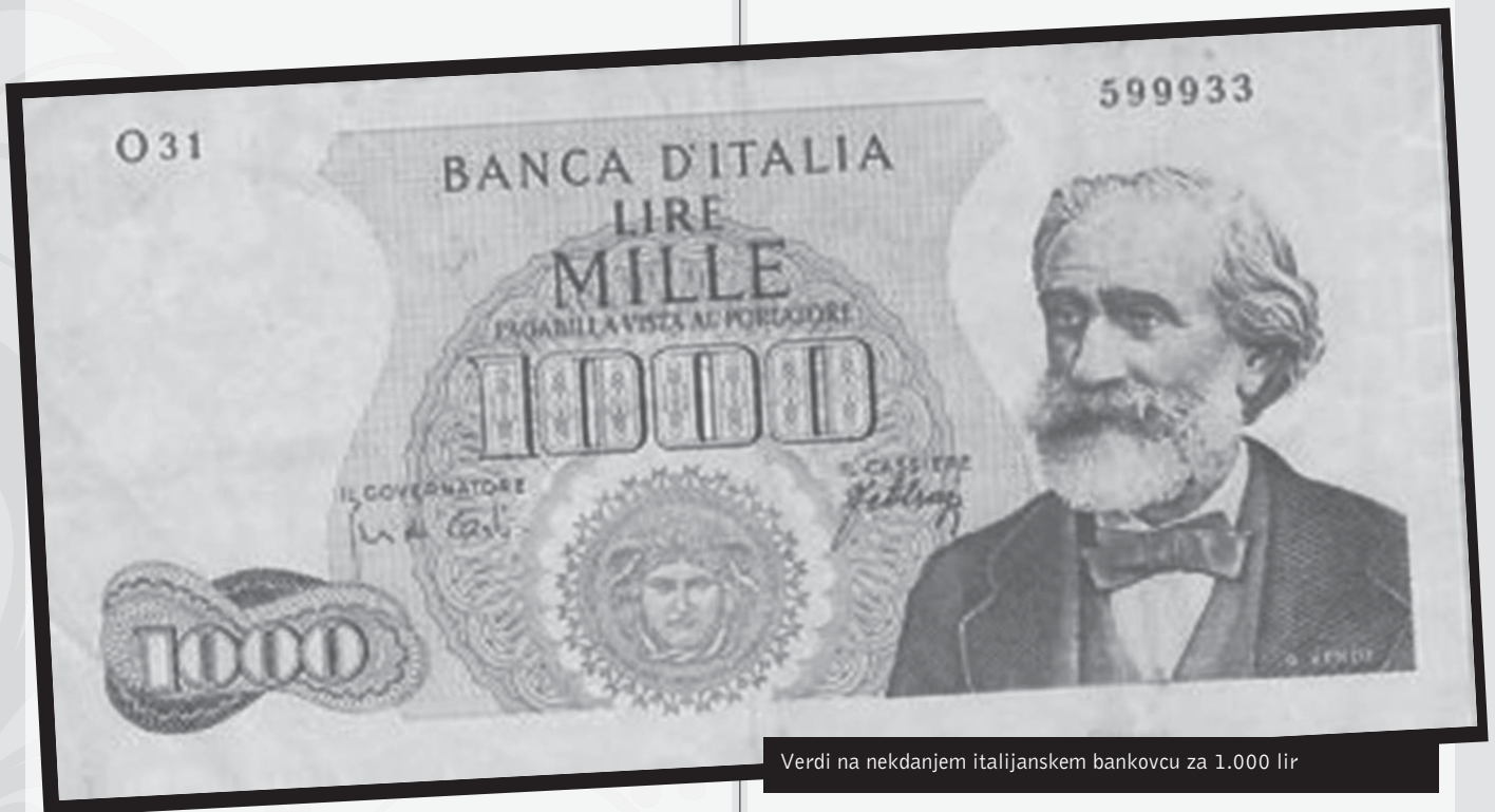
Verdi na nekdanjem italijanskem bankovcu za 1.000 lir

Verdi je kot pravi ljudski umetnik svoje skladateljsko delovanje v Italiji povezal z naprednimi tokovi in številne njegove opere so, zlasti v zgodnejšem obdobju, postale celo pomembno politično sredstvo. Po naključju njegov priimek sestavljajo začetnice besede Vittorio Emanuele, Re d'Italia, in klic Eviva VERDI je bil obenem tudi bojni klic.