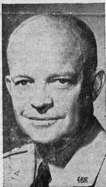
General Dwight EISENHOWER, vrhovni poveljnik zaveznških ekspedicijskih sil v Evropi med drugo svetovno vojno ter sedanji vrhovni poveljnik atlantskih obrambnih sil.

Eisenhower je prišel v nedeljo v Pariz, da obišče države atlantskega pakta. Po obisku se povrne v Ameriko. V Evropi se bo nastanil šele sredi februarja. V nedeljo se je z sestalo s maršalom Montgomeryem ter s številnimi francoskimi vojaškimi funkcionarji. Govoril je tudi po radiu ter povedal, da se vrača v Evropo kot vojaški poveljnik. Dejal je tudi, da nobena zunanja pomoč ne more braniti Evrope. Treba je najti voljo in moralne sile ter sredstva za zgraditev obrambe v Evropi. Mislim, da grozi nevarnost vsem, in zato se ji moramo zoperstaviti vsi. Naša zveza bo dokazala, da je to bolj zavezništvu za mir kot za vojno. Zgleda, da se bo Eisenhower domenil z odgovornimi francoskimi činitelji o njihovem prispevku v skupno atlantsko vojsko. V zvezi z Eisenhowerjevim obiskom v Evropi je vodja ameriških pomorskih sil v Evropi admiral Carney izjavil, da je pooblaščen nuditi svojo pomoč ozemeljskim silam, ki so pod Eisenhowerjevim poveljstvom.