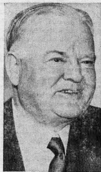
Bivši predsednik Združenih držav Herbert HOOVER, ki zagovarja novi ameriški izolacionizem, o katerem smo govorili v prejšnji številki.

Mac Arthur je v novoletni poslanici japonskemu narodu napovedal, da se bo morala tudi Japonska ponovno oborožiti, če se položaj v svetu ne bo izboljšal.