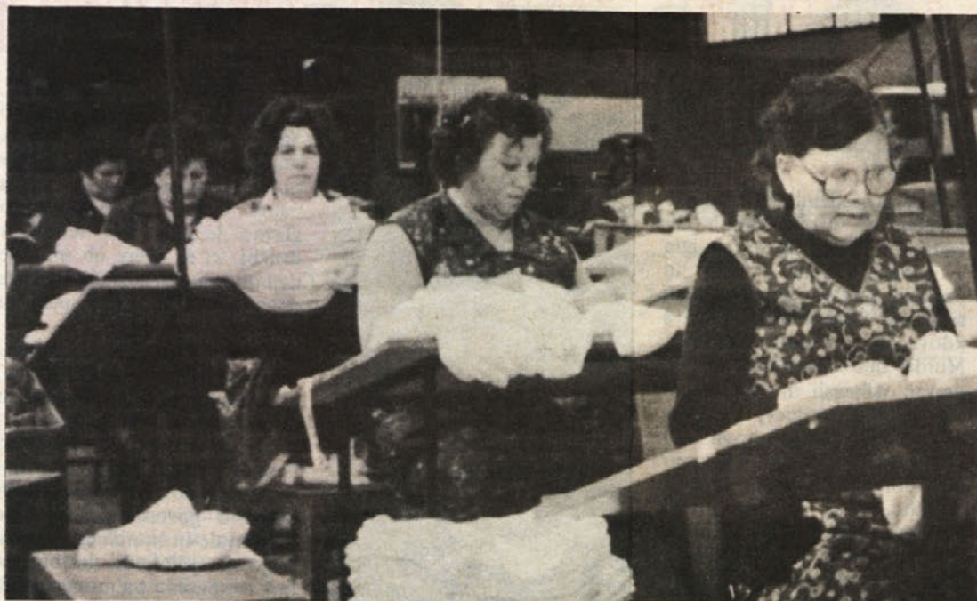
ZMERAJ DOBRO PRIPRAVLJENE – Dekleta iz Betine ekipe prve pomoči so vedno dobro pripravljene. To se je pokazalo tudi na občinskem prvenstvu ekip prve pomoči, ki je bilo v Rosalnicah. Te vrste izobraževanja in urjenju posvečamo v Beti veliko pozornost, saj se zavedamo pomena in koristi dobro izurjenih ekip.