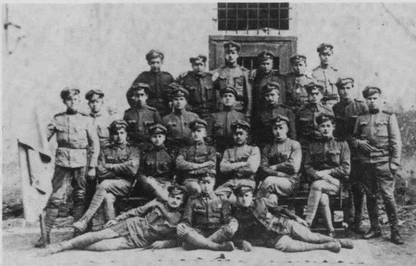
Pripadniki Slovenskega planinskega polka z značilnimi kapami tedanje slovenske vojske in z veliko zastavo SHS na Koroškem leta 1919.