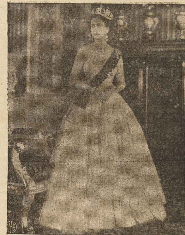
FOTOGRAFOVO VESELJE — Res kraljevski prizor za fotografa. Kraljica Elizabeta II. čaka v "zeleni oblačilnici" buckinghamske palače na fotografiranje.