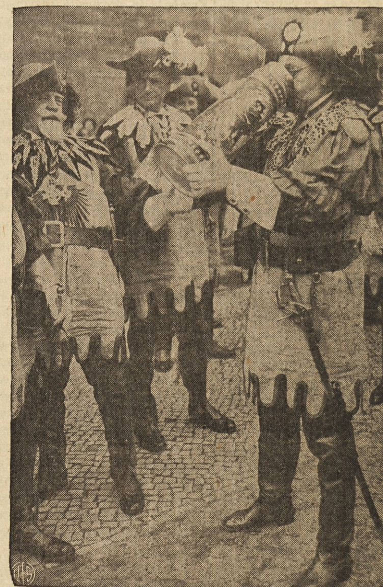
PO "ZMAGI" — Oblečeni v obleke pankrfskih vite-zov iz 14. stoletja pijo stari Berlinčani iz ogromnega kame-nitega vrča zmagoslavni napoj "po bitki s sovražnimi sosed-i." Pankgrafi so bili gospodarji in varuhi nemških vas-i, ki so stale na tleh današnjega Berlina.

Povejte to sosedu, ki še ni naročen nanjo