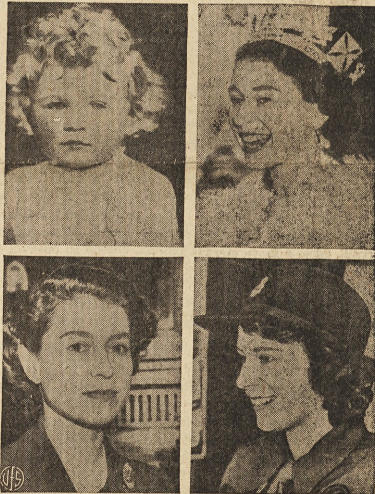
IZ ŽIVLJENA ELIZABETE II. — To so štiri slike iz življenja mlade angleške kraljice. Zgoraj na levi jo vidimo v starosti enega leta, tedaj je bila še samo princesa in šele kot tretja na vrsti za nasledstvo. Na desni jo vidimo že kot kraljico. Slika na levi spodaj je bila posneta o Božiču 1952, ko je Elizabeta govorila svojim narodom preko radija, na desni pa je kot 16-letna v vojaški uniformi med zadnjo vojno.

SEOUL, Koreja. Marian Anderson, znana kontra-altistka, ki je črnkega plemena, je dospela v Korejo, kjer bo pela ameriškim vojakom.