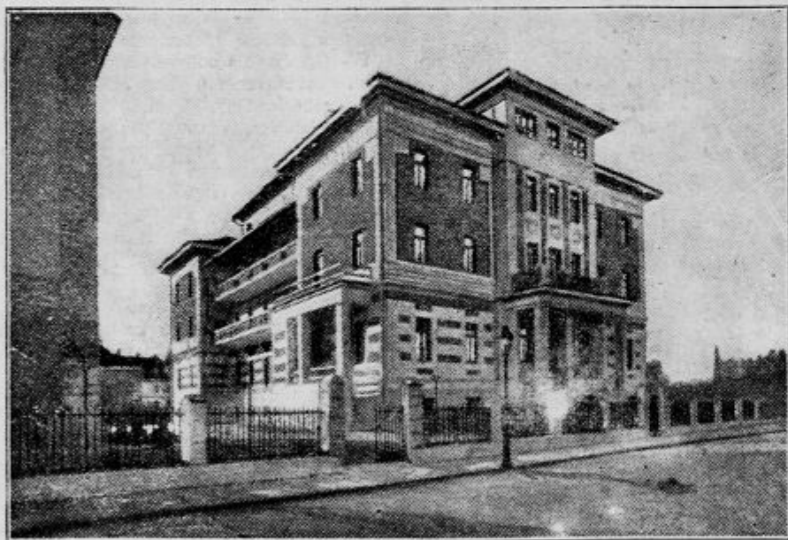
Penzionat «Mladika» v Ljubljani.

V najlepšem delu Ljubljane, poleg mestne ženske realne gimnazije, na oglu Subičeve in Levstikove ulice, v bližini Tivoljskega gozda in obdana krog in krog z vrtom in parkom, se nahaja moderna stavba penzionata «Mladika». Penzionat je namenjen onim gojenkam, ki hočejo posejati gospodinsko šolo, žensko realno gimnazijo ali pa tudi kako drugo šolo, sploh vsem onim deklicam, ki žele izpopolniti svojo izobrazbo v kaki stroki.