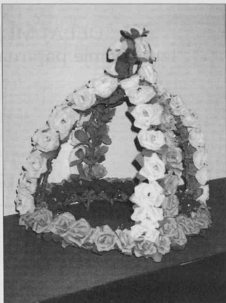
Mrliški venec (koróna). Muzej Avgusta Pavla, Monošter (foto M. Kozar). ♦ Funeral wreath (koróna). Avgust Pavel Museum, Monošter (photo M. Kozar). ♦ Couronne funéraire (koróna) Musée d'Avgust Pavel, Monošter (photo M. Kozar).

Slovaškem in v Sloveniji – pa tudi na Poljskem in v Litvi. Najbolj znani samostani po izdelovanju umetnih cvetlic so samostan sv. Klare v kraju Nola pri Neaplju in samostani sv. Nikolaja, sv. Jerneja in sv. Duha v Genovi.