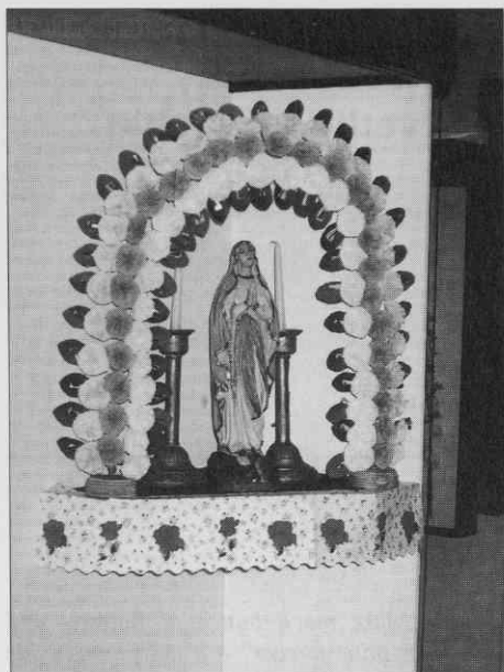
Bogkov kot (kóut). Muzej Avgusta Pavla, Monošter (foto M. Kozar). ♦ House altar (kóut). Avgust Pavel Museum, Monošter (photo M. Kozar). ♦ «Coin de Dieu» ( kóut ). Musée d'Avgust Pavel, Monošter (photo M. Kozar).