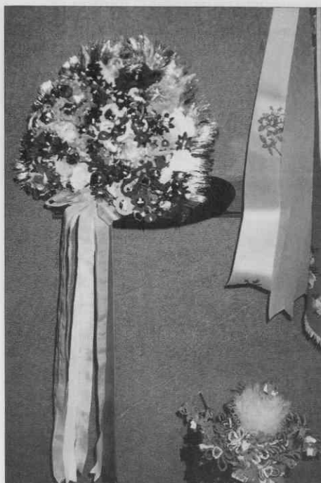
Šopek (korina) na klobuku zvača. Muzej Avgusta Pavla, Monošter (foto M. Kozar). ♦ Bunch (korina) on a wedding guest's hat. Avgust Pavel Museum, Monošter (photo M. Kozar). ♦ Bouquet (korina) sur le chapeau de «zvač». Musée d'Avgust Pavel, Monošter (photo M. Kozar).