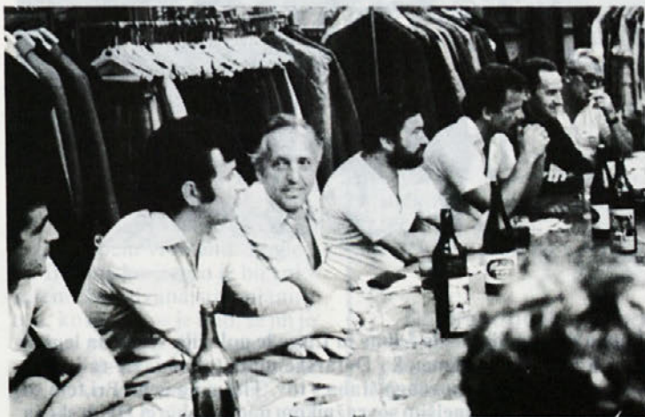
S srečanja šoferjev ob njihovem prazniku.

Da bodo akcije usklajene, bo delavski svet delovne organizacije potrdil razširjen odbor, v katerem bodo člani vseh tozdov in DSSS, pa tudi temeljne organizacije bodo morale za aktivnosti v svojih okoljih imenovati odbore za obeležitev praznika. Torej bomo z organiziranostjo ter pretehtanim in racionalnim odnosom skušali dati obletnici in času primeren poudarek, prek tega pa mora biti našemu delavcu namenjen delež, ki si ga je in si ga še z delom in z gradnjo našega Laboda zasluži.