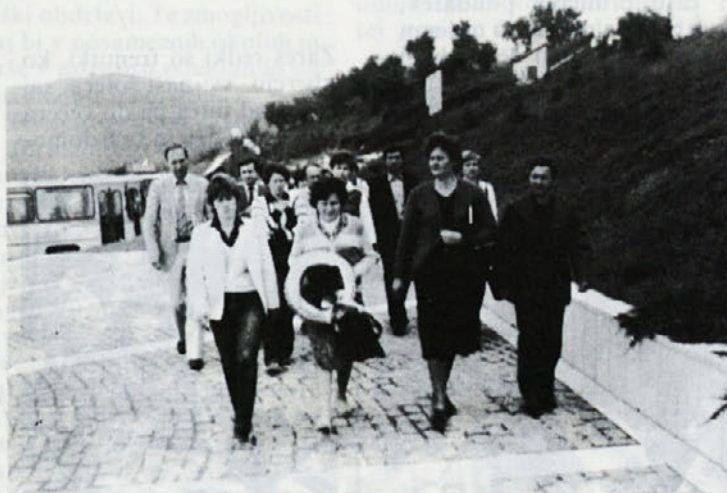
Skupna delegacija tozda Libne in Lisce je položila venec na legendarni Kadinjači k spomeniku Delavskemu bataljonu. Le-ta je leta 1942 branil umik Vrhovnega štaba s tov. Titom na čelu. Pri tem so v boju s trikrat številnejšim sovražnikom padli vsi borci Delavskega bataljona.

Dopoldne so si ogledali Kadinjačo, ki izdeluje pletenine, in Tarateks. V slednji delovni organizaciji, ki je po vsebini dela bližje proizvodnemu programu Libne, so stekli tudi zanimivi pogovori. To je delovna organizacija, ki se naglo razvija. Ta čas dokončujejo tudi novo proizvodno halo, sicer pa imajo zelo dober strojni park, urejeno otroško in zdravstveno varstvo.