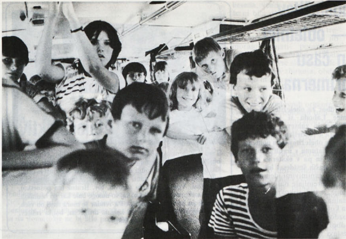
Na poti domov je bilo v avtobusu vse živo. Otroci so si izmenjavali naslove, naročali to in ono, peli, skratka: do konca so ostali homogena skupina.