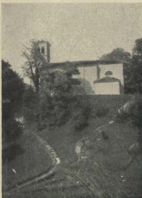
Cerkev v Trčmunu