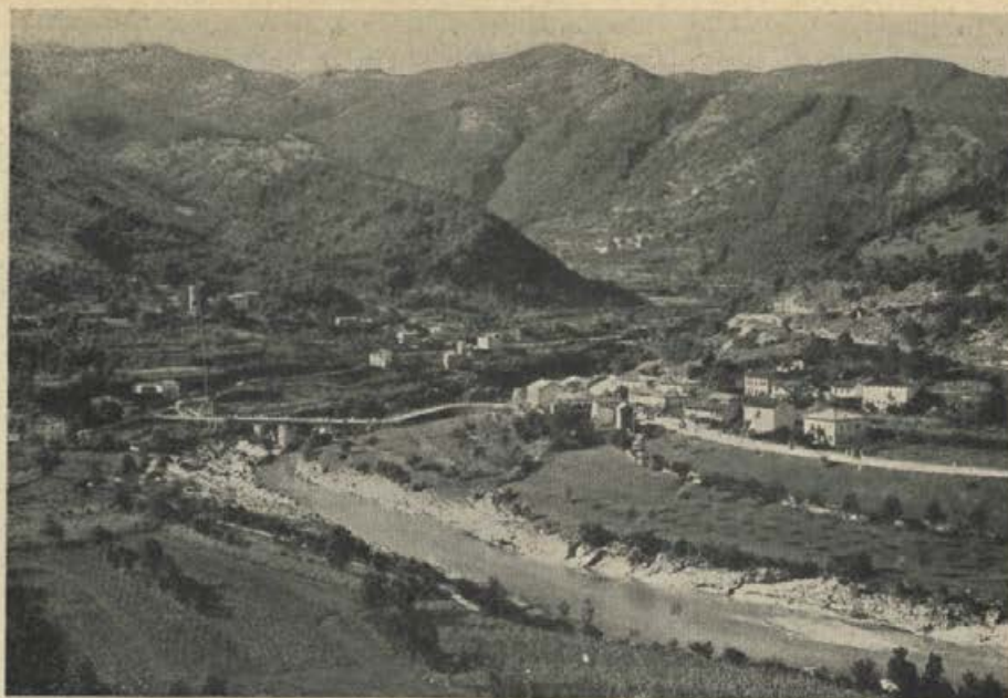
Soča pri Plavah