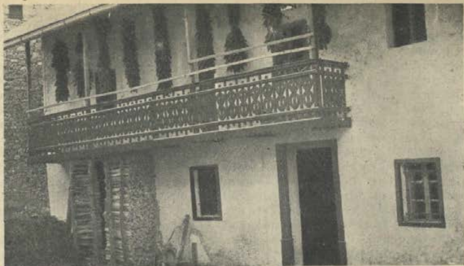
Gregorčičeva rojstna hiša