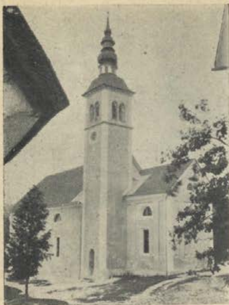
Cerkev na Sentviški gori

tovo trgovino v Trstu. Že zelo zgodaj je začel plezati po gorah. Zlasti so mu bile pri srcu Julijske Alpe, na katerih je našel več novih poti (n. pr. Kugyjevo pot iz Trente na Triglav). Zanimale so ga pa tudi Zapadne Alpe in drugi predeli Alp. O Kugyju lahko rečemo, da je do dobra preiskal Julijske Alpe. Ko ni mogel več na gore, jih je pa hodil gledat v Kanalsko dolino. O gorah je napisal več lepih knjig, ki so polne neke tihe, mehke poezije. Človek jih bere s pravim užitkom. Dr. Kugy je bil kot planinec svetovno znan.