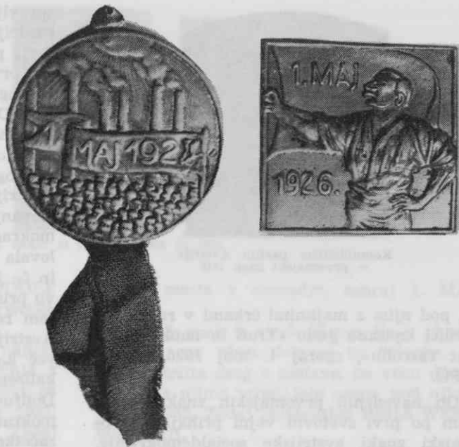
Prvomajska znaka mariborskih kovinarjev iz let 1923/4 in 1926

ska znaka, ki sta v dvajsetih letih nastala v Mariboru — prvi 1923/24 in drugi 1926. Oba sta bila izdelana v Kovini DD Tezno. Kot se spominja eden izmed takratnih vajencev v tej tovarni, 3 so delavci te znake izdelali sami, ne da bi mojster vedel zanje. Naročnik je bil sindikat Društva kovinarjev Tezno, pozneje Savez metalskih radnika. Kovinarji so bili sindikalno organizirani na Tezno v Kovini DD in Stavbni družbi (Kovina DD je bila predhodnica današnje Elektrokovine, Stavbna družba pa predhodnica Metalne). Sindikat je imel po 70 članov, tudi 90, več kot 100 nikoli, v času krize samo 29. Izdelanih je bilo 200 znakov, kupili so jih člani sindikata in tudi drugi delavci. Denar je bil dohodek za organizacijo. Pri prvomajskih znakih ni bilo razlik in so jih nosili tudi komunisti.