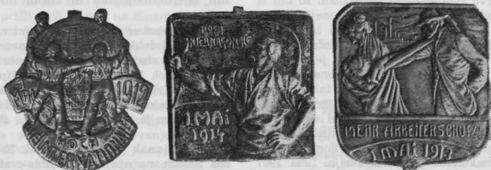
Prvomajski znaki iz let 1912, 1914 in 1913

Prvi znani znak iz let po prvi svetovni vojni je nastal v Mariboru in se je tako po nastanku bistveno razlikoval od znakov pred prvo svetovno vojno, ki so prišli k nam od drugod. Lahko sklepamo, da so se delavci v Mariboru odločili za svoj znak zato, ker ni bilo znakov z Dunaja. Znak, ki ga poznamo kar v treh primerkih, je nastal leta 1923, v vseh treh primerkih pa ima čez številko 3 udarjeno številko 4, torej gre dejansko za znake iz obeh let. Mogoča je razlaga, da je bila nova letnica udarjena na neprodane znake iz prejšnjega leta (kar ne bi bilo nič čudnega in je, na primer, enako počel tudi ljubljanski velesojem s svojimi znaki), lahko pa, da se mariborski delavci leta 1924 zaradi takšnih ali drugačnih razlogov niso odločili za nov znak in so čez svoje stare znake organizirano udarili samo novo letnico. Kakorkoli že, vemo za dva prvomaj-