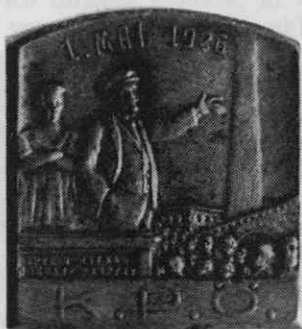
Komunistična partija Avstrije — prvomajski znak 1926

ci, pod njim z majhnimi črkami v ruščini in cirilici izpisano geslo »Trud in nauka pobe- dat razruhu«, zgoraj 1. maj 1926, spodaj KPÖ.