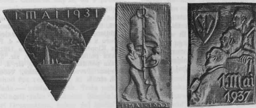
Prvomajski znaki iz let 1931, 1932 in 1937

Ob koncu je treba odgovoriti na vprašanje, ali lahko govorimo o prvomajskih znakih avstrijske socialdemokracije kot o naših znakih, odgovor je pritrdilen. Naši delavci na Slovenskem so jih nosili kot svoje, ne glede na to, kje so bili izdelani. Enako je organizirano potekalo njihovo razdeljevanje.