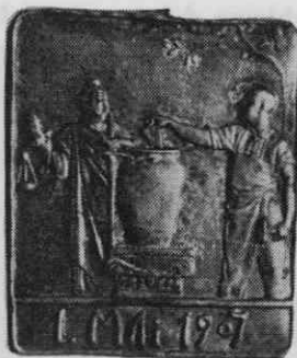
Prvomajska znaka iz leta 1905 in 1907