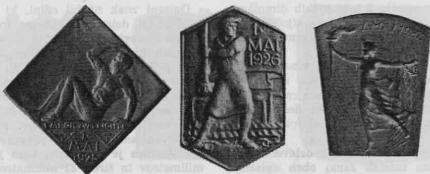
Prvomajski znaki iz let 1925, 1926 in 1927

— 1926: znak je visok 34 mm, širok 22,5 milimetrov, na njem delavec, ki drži v rokah veliko razvito zastavo, na njej 1. MAI 1926, v ozadju tovarniški dimniki, levo ob robu z