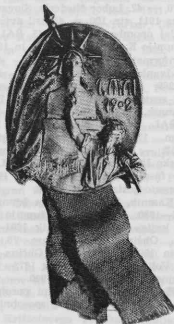
Najstarejši znani ohranjeni prvomajski znak na Slovenskem. Leta 1902 ga je ob prvem maju nosil eden izmed mariborskih delavcev. Ker je bil narodno zavezen, ga je motila nemška beseda Freiheit in jo je preprosto spraskal. Škoda, da na črno-beli fotografiji ni mogoče videti, da je znak svetlo srebrne barve, zastava je rdeče obarvana, rdeč je tudi trakce pod znakom

Zbirateljske menjalne poti so tako prepredene, da je težko trditi, da je ta ali oni znak doma prav tam, kjer se je pojavil, kljub temu pa so bili dobesedno vsi prvomajski znaki pred prvo svetovno vojno, za katere smo vedeli ob razstavi Naše stare značke, najdeni v Mariboru ali vsaj po po-reklu iz tega mesta. To dejstvo ne govori o