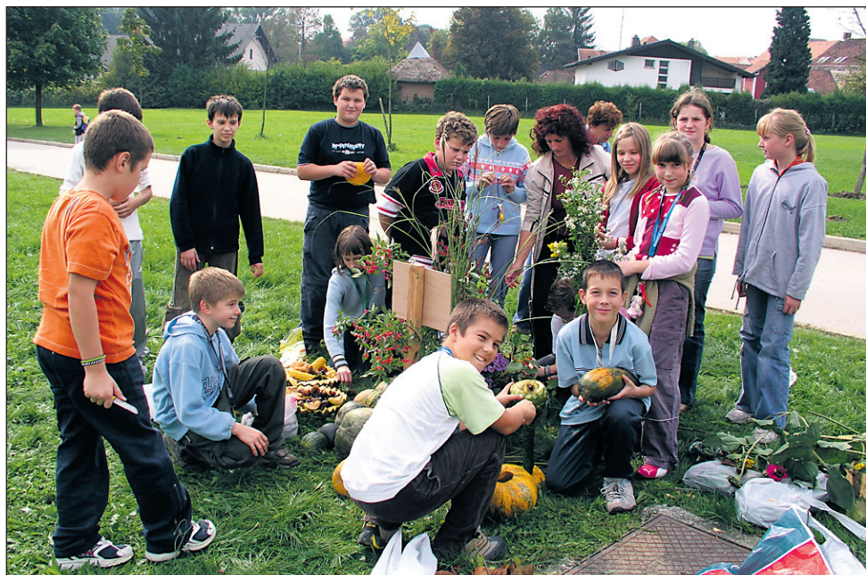
Učenci so bili pri delu zelo zavzeti, še posebej so se okrog svoje bučne gosence in jesenskega aranžmaja trudili učenci 5. b-razreda.