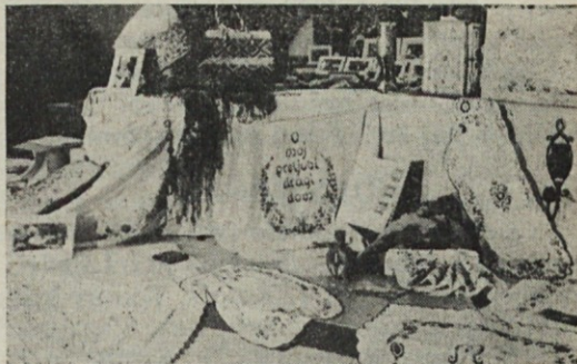
Pogled na del jubilejne razstave slovenskih izseljencev v Heerlenu na Holandskem.