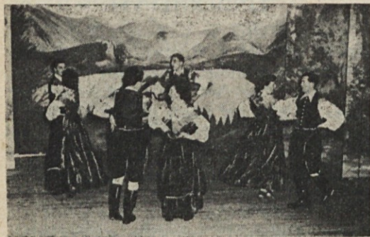
Slovenski fantje in dekleta v narodnih nošah nastopajo na jubilejni proslavi Zveze društev sv. Barbare v Holandiji.