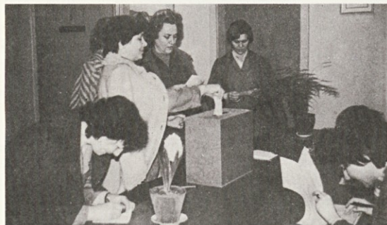
Glasovali smo ZA . . .

Realiziranje programa na področju delitve sredstev za osebne dohodke in skupno porabo se je pričelo s pripravo predloga samoupravnega sporazuma o skupnih osnovah in merilih za delitev sredstev za osebne dohodke in skupno porabo, ki se je skozi javno razpravo dopolnjeval in oblikoval v