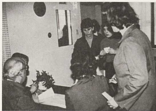
Pred odločitvijo . . .

skladu z izhodiščnimi načeli Zakona o združenem delu, ki so opredeljeni v 127., 128., 129. členu in tudi ostalih členih Zakona.