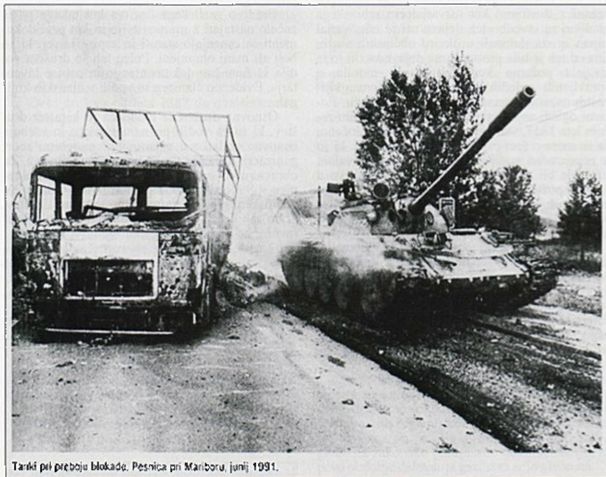
Tanki pri preboju blokade. Pesnica pri Mariboru, junij 1991.

Fire-fighting as organised activity was regulated by the Fire Law in 1886, which foresaw the organisation of fire precaution as public or private institution, which main tasks were the saving of lives and property.