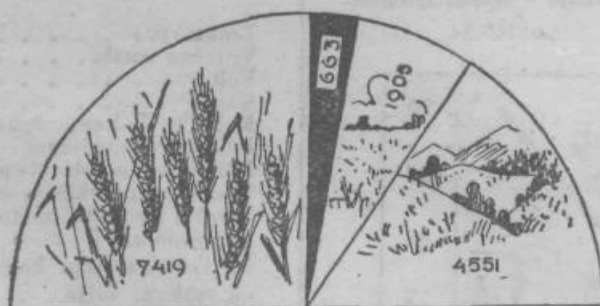
Od skupne obdelovalne površine 9.982 tisoč ha odpade v Jugoslaviji 7.419 tisoč ha na orno zemljo in vrtove, 663 tisoč ha na sadovnjake in vinograde, 1.905 tisoč ha na travnike. Ostalih 4.551 tisoč ha kmetijske površine pa so pašniki.

Holandska gospodarstva so zelo intenzivna. Čeprav po površini niso velika, pa imajo vse odlike velikih gospodarstev zaradi znatnih količin vloženega kapitala na enoto površine. Tako razvito kmetijstvo z visoko produktivnostjo na enoto površine in prebivalca izkorišča in uporablja dosežke znanosti, o čemer bomo govorili v eni izmed prihodnjih številok.