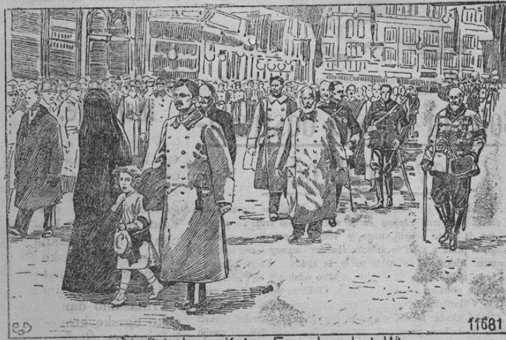
Die Beisetzung Kaiser Franz Josephs in Wien.

V predzadnji številki smo podali natančno poročilo o žalovnih priredbah ob priliki pogreba pokojnega našega cesarja Franc Jožefa. Čeprav par tednov pozneje, prinašamo danes eno sliko iz pogrebnih priredb. Naša slika kaže v ospredju novega cesarja Karla I. v spremstvu cesarice Čite; med njima pa koraka njuni sinček, sedanji naš prestolonaslednik. Za njima vidimo ostale vladarje prijateljskih držav in njihovih zastopnike ter prestolonaslednike, ki so se pogreba udeležili. Žalovnega voza s cesarjevo krsto na naši sliki ni videti.