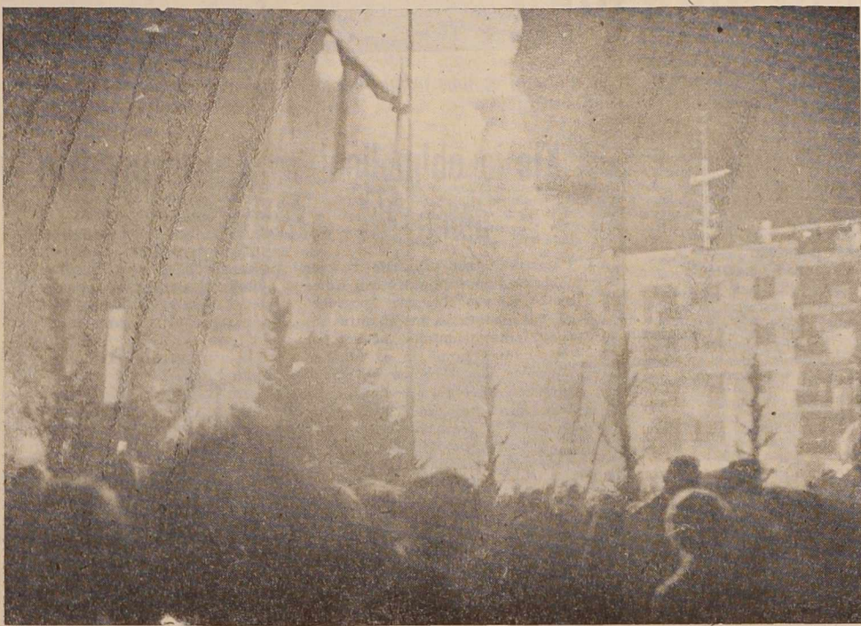
V PREDKONGRESNIH RAZPRAVAH ČIM VEČ

Vsekakor pričujoča analiza vsebuje precej kritičnih ugotovitev, ki zahtevajo tudi širše proučevanje teh problemov in sprejem določenih ukrepov.