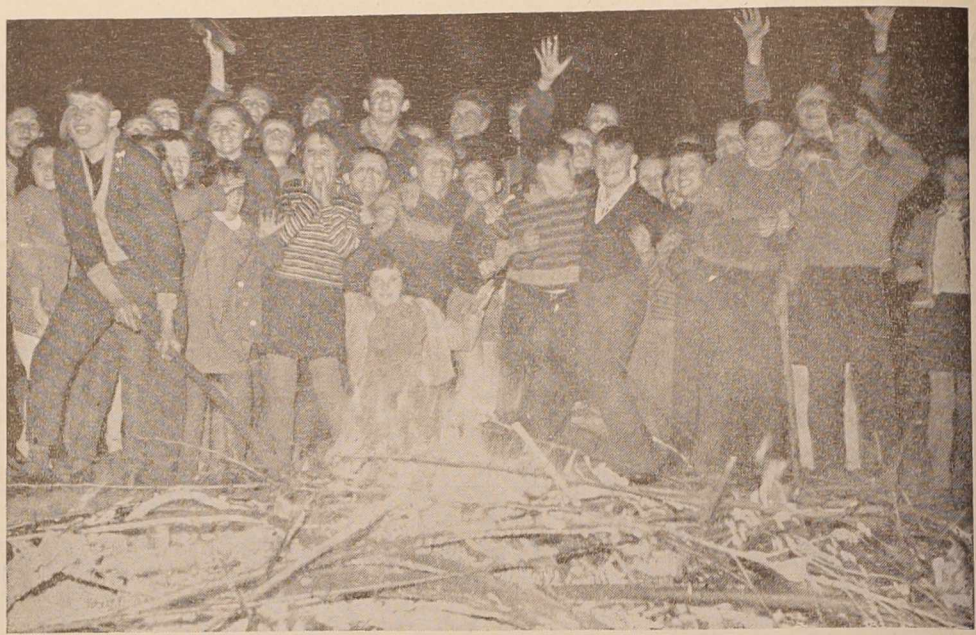
Pionirski odred na osnovni šoli II v Murski Soboti, ki nosi naslov po znanem partizanskem borcu Karlu Destovniku-Kajuhu je pred dnevi praznoval: pionirji ob ognju