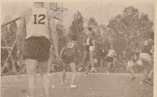
Z nedeljske tekme med košarkarskima reprezentancama Zah. Nemčije in Slovenije v Radencih