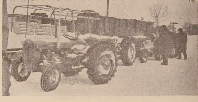
V tej gospodarsko-propagandni reportaži: Transport traktorjev

Strokovna služba pri Združenju je namenjena predvsem pospeševanju kmetijske proizvodnje in dajanju pomoči članicam na tem področju. Obstoječe strokovne komisije pri Združenju proučujejo posamezne strokovne naloge in iščejo za njih izpolnjevanje ustrezne rešitve. Tako je na pr. komisija za živinorejsko proizvodnjo že analizirala obseg izpada v prasičarji in živinoreji, potem pa si naložila obveznost, da bo poskrbela za manjkajočo število pujskov za vzrejo bekono in mesnatih svinj. Prizadeva si tudi za uveljavljanje večjih rejjskih središč, zato priporoča kmetijskim organizacijam, naj si rejjska središča še povečajo predvsem s plemenskimi svinjami in si pridobijo čimveč reprodukcijskega materiala.