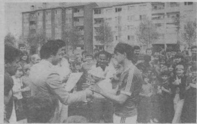
Prehodni pokal na turnirju v malem nogometu je zaslužen osvojiła ekipa Sing-Sing (na sliki), v košarki pa ekipa Bratov Tuma.