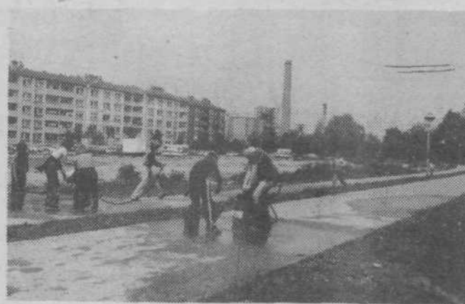
Takole se pripravljajo ekipa pionirjev in pionirk gasilskega društva Bizovnik — enote Štepanjskega naselja, na tekmovalje z vedrom in šafeto 30 x 9, ki bo v Šmartnem ob Savi ob 80-letnici gasilskega društva. Želimo jim, da bi bili na tekmovalju čim uspešnejši.