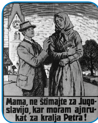
Nemci so (v slovenskoj rejči) tomačili, ka so Jugoslovani za bojno, Avstrijci pa za mér

Gnesnedén se v matičnoj domovini dosta špekulejra, ka bi prej vse ovak bilau, če bi se mogli Korošci tistoga ipa nej za Jugoslavijo, liki za Slovenijo odlaučati. Donk pa prej ne smejmo pozabiti: 10. oktobra 1920 se je kauli 60 procentov vsej Korošcov s slovenskov maternov rečjauv odlaučilo za priklüčitev k matičnoma narodi. Té rezultati kažejo na tau, ka je bila med slovenskimi lidami na Djužnom Koroškom edna večina, štera je stejla gordržati svojo slovensko identiteto, če rejsan bi se mogla prikapčiti k ednoma nauvoma ino cejlak neznanom rosagi.