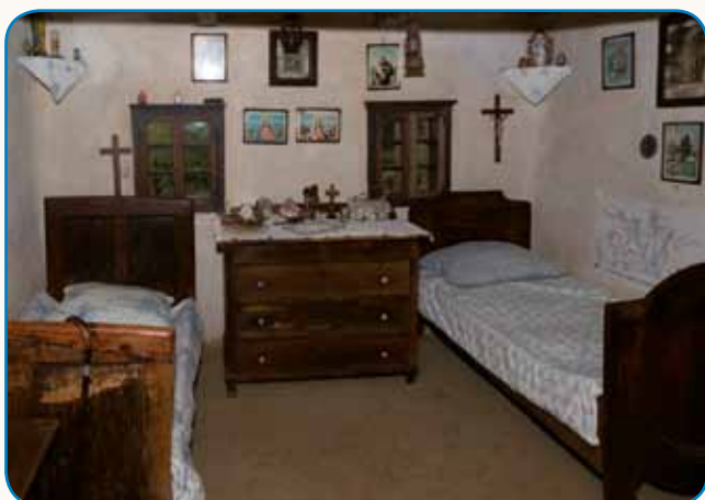
»Pri njoj je nika nej šlo na nikoj« stran 3