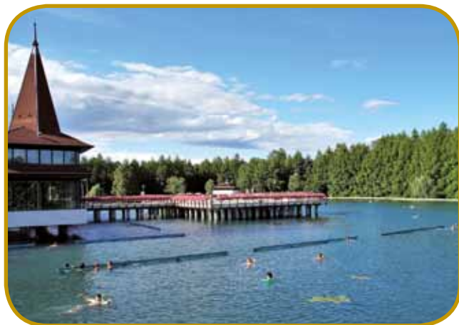
Jezero v Hévízi - v zimi dobi njegva voda »parno šapko«, zatok se ne rasladi vó ino tak leko vrači gutanje

nejvedoč najšli 52 mejterov globko ino 3 kilomejtere dugo djamo, šteri labirint je trnok veuka naravna vrednost (samo njegvi začetek leko gorpoiškemo). Malo dale, nad vesjauv Rezi , vidimo z grada na 418 mejterov viskom bregej daleč - celau do Sümega ino Badacsonya. Spodkar