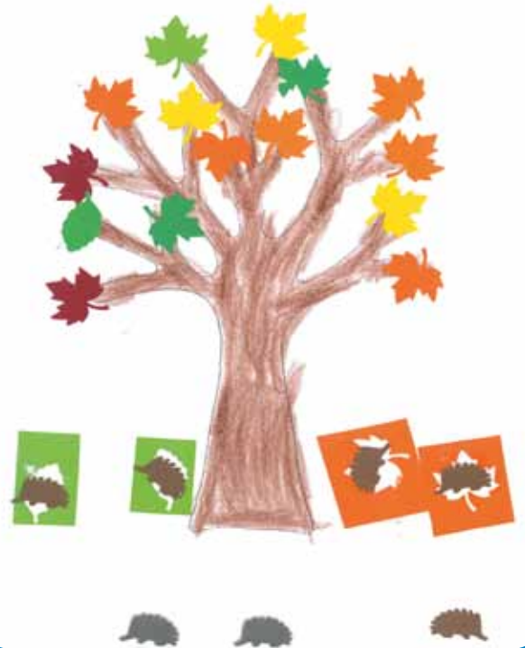
VIKTÓRIA, 6 LET, VRTEC GORNJI SENIK