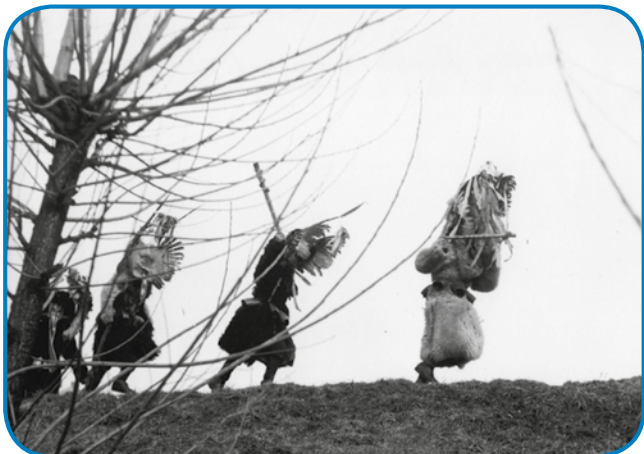
Kurenti prihajajo, 1967

nil se je v Fotoklub Maribor, ki je v drugi polovici šestdesetih let doživljal svoj ustvarjalni vrh. Ožja skupina članov, med njimi