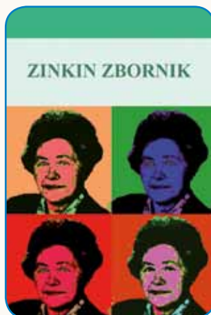
ZINKI ZORKO, VSEM NAM,... stran 3