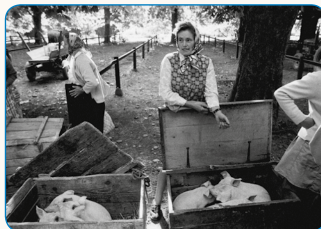
STOJAN KERBLER - MOJŠTER FOTOGRAFIJE stran 6