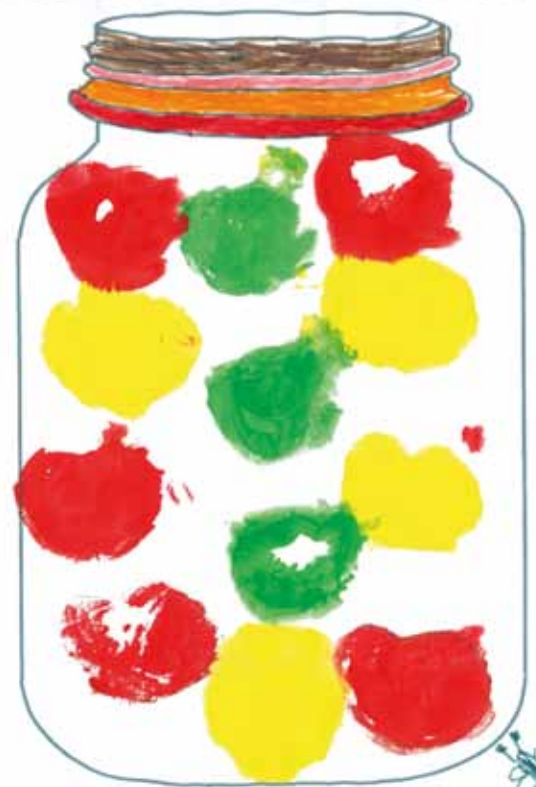
EVELIN, 6 LET, VRTEC GORNJI SENIK