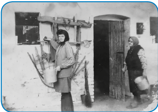
S svojo taščov pred domanjo štalov, pripravlata se krave dojit

»Tau je pri nas, da smo zabadali, na tjejpj je moj brat, te njegvi sin Berci pa moj mauž je še paulek. Te je še cejlak ovak bilau zabadanje kak zdaj, te so si še čas vzeli za tau, zdaj vsikši silo ma pa vse