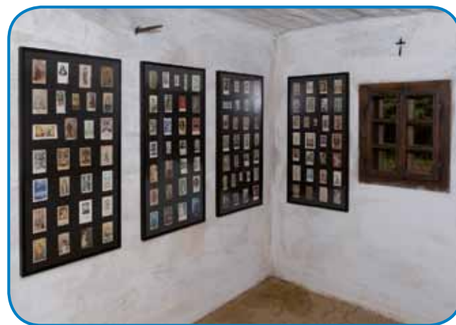
V zadnjoj iži so razstavljeni kejpeci (Tomislav Vrečić)

vküper smo najšli več kak 290 kejpecov, svetih podob, stere smo zdaj razstavili v tistoj maloj, zadnjoj iži.«