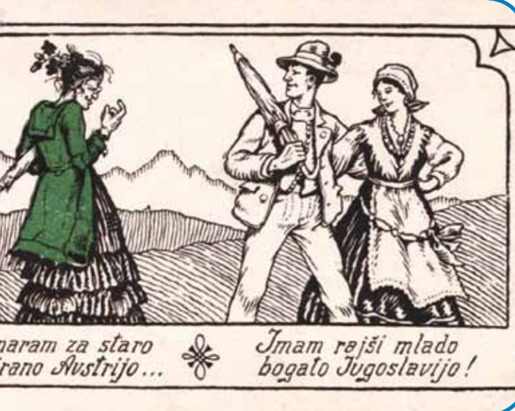
Propagandna razglednica - na plebisciti je zelena farba znamenüvala »staro Avstrijo«, bejla pa »nauvo Jugoslavijo«

Gnesneden ništérni čednjaki tomačijo, ka se je dosta lüstva s slovenskov maternov rečjauv za Avstrijo odlaučilo z več zrokov: koroški slovenski pavri so bili navezani na senja v Celovci ino