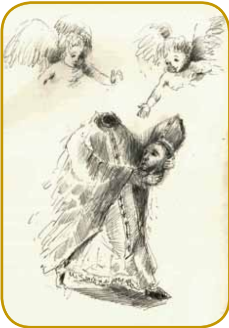
Bregj v Pariži, na šterom so dojsekli glavau svetoma Dioniziji ino njegovim tivarišom, nosi francusko ime »Montmartre« - »Bregj mantrnikov«

Dostakrat kritizérajó žitek kartuzijanov, ka se prej zapréjo kraj od svetá ino stiskavajo oči pred problemi lidi. Uni pa pravijo, ka človečanstvi z molitvov pomagajo. Na