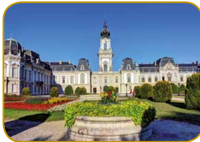
Festeticsa dvorec v Keszthelyi - njegva knjižnica má 86 jezera knjig, leko si pa tam poglednemo djagersko ino železniško razstavo tó

Prvi Madžari so do Blatnoga jezera prišli kauli leta 900. Kisnej je krajina dosta trpela pod Törki, eške samo v 18. stoletji je k sebi prišla. V »reformnom cajti« se je začno tam turizem, septembra 1846 se je na vodej oprvim pelo eden šift na paro. Najbole bogato tradicijo kauli Balatona nosi varaš Keszthely , šteri je v časi držine Festetics eričen grato. Dvorec familije má stau edno sobo, spoznamo ga po visikom tórmu z lükastov kupolov. Znautra leko dosta zvejmo o življenji velikašov v 18.-19. stoletji,