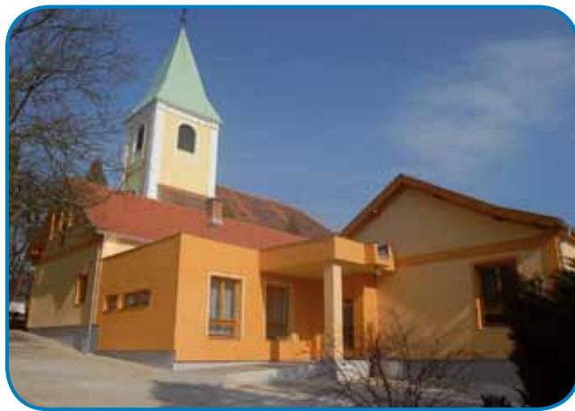
Cerkev sv. Štefana Hardinga v Števanovcih naj bi se obnovila s skupnimi močmi obeh držav

Med priporočili smo prebrali, da »slovenska stran za naslednje štiriletno obdobje (2021-2024), v sodelovanju s slovensko skupnostjo v Porabju, pripravlja program za spodbujanje gospodarske osnove slovenske narodne skupnosti