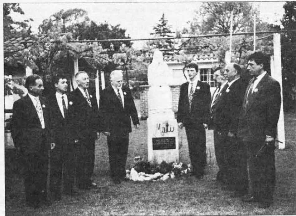
Logaški okteti je zapel v zavetišču škofa Rožmana ob materinskem dnevu.