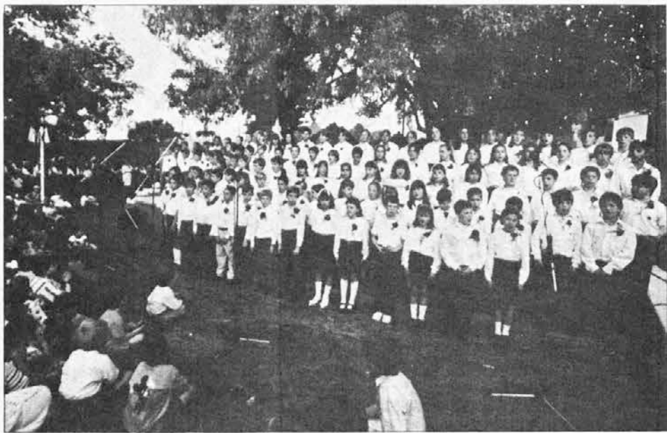
Deklamacija šolskih otrok na Slovenskem dnevu.