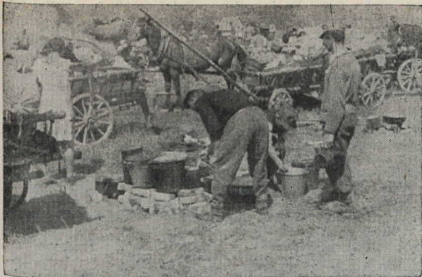
Domobranci na Vetrinškem polju pripravljajo jed.