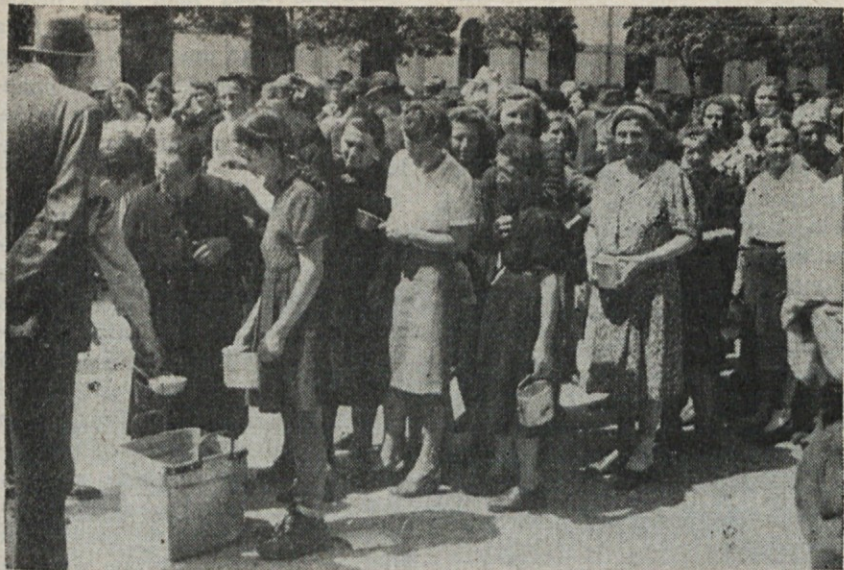
Poslopje malega semenišča v Vidmu v Italiji je 13., 14. in 15. maja služilo za prehodno taborišče za slovenske begunce. Po napornem potovanju v natrpanih tovornjakih iz Beljaka na Koroškem se je prilegla topla hrana iz skupne kuhinje.