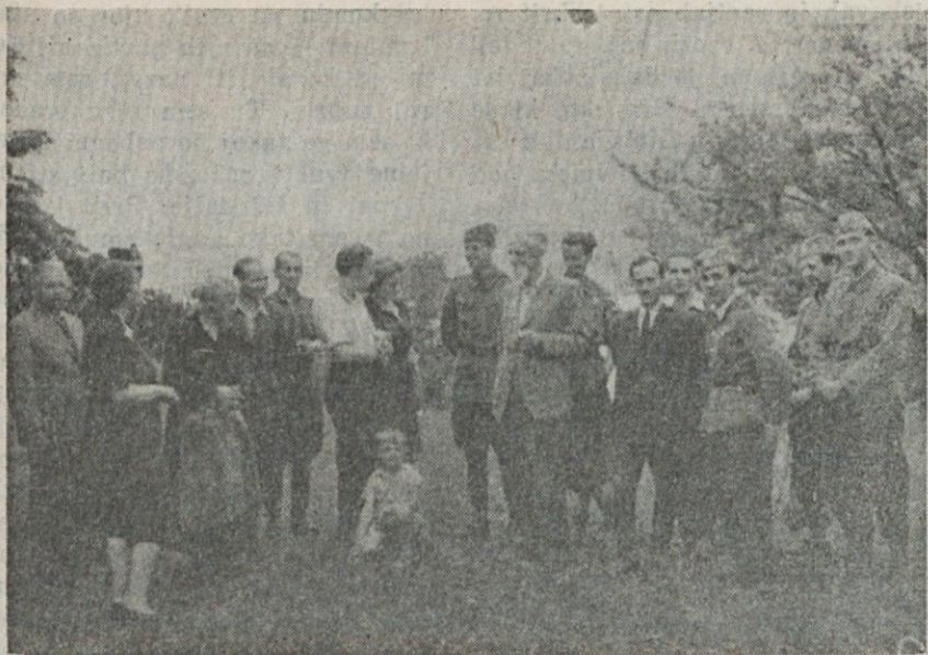
General Leon Rupnik, vrhovni poveljnik domobrancev, v Vetrinju.