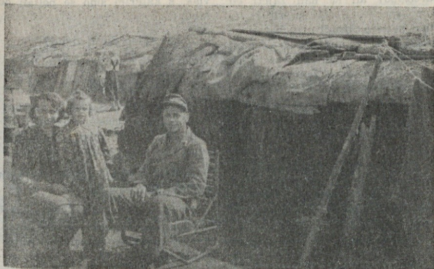
Prvi dnevi v Vetrinju. Življenjske razmere skrajno siromašne. Ni pa še bilo slutnje o grozeči nevarnosti za domobrance.