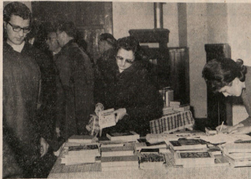
Z razstave slovenskih knjig v Prosvetnem domu na Opčinah. Razstavo je pripravilo P D «Opčine». Zanj je vladalo veliko zanimanje

Dandanes v Ameriki ni več sužnosti v starem pomenu besede, v južnih državah pa črnem še niso priznali enakopravnosti in jih zapostavljajo skoraj prav tako kakor sužnje. To pa je značilno za sedanjo Ameriko, sto let po Lincolnovem razglasu.