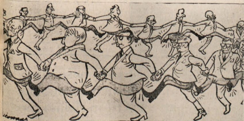
Tako izbirajo naslednika za Adenauerja... Kot je znano bi moral stari Adenauer v kratkem zapustiti mesto kanclerja Zahodne Nemčije. V zvezi z njegovim nasledstvom je nastalo v Bonnu veliko preklanja. Povsem razumljivo... (Karikatura je povzeta iz lista «Wochenspost»)