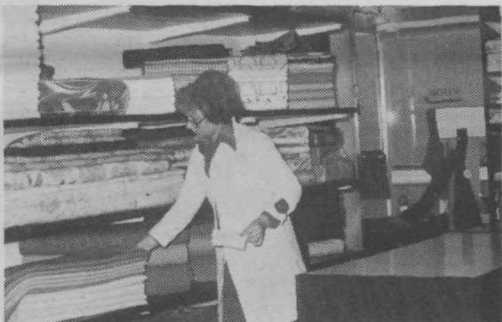
MANUFATURA v Rojčevi ulici – ena od redkih specializiranih trgovin v naši občini

Uredništvo Naše skupnosti, Ob Ljubljani 42/II, 61000 Ljubljana.