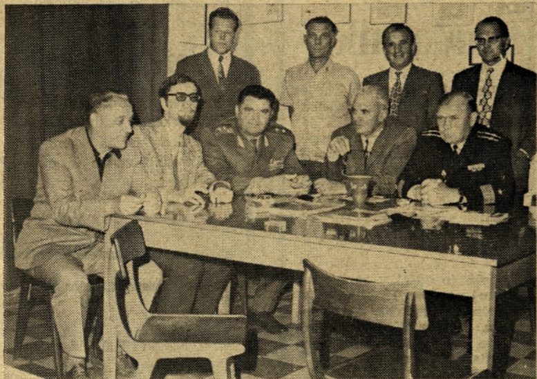
Na obisku pri našem društvu LT je bila delegacija LT iz SSSR — Ukrajina