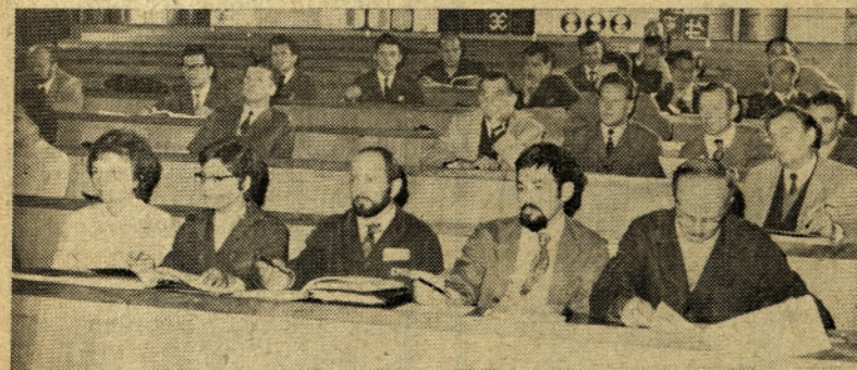
Vodilni in vodstveni delavci so obiskovali seminar o organizaciji dela in kot kaže, so se menda nekaj naučili