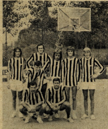
To so naši vrli fantje, ki so zmagali v rokometu

druga 12, tretja 11 točk. Vsako naslednje nižje mesto pa točko manj.