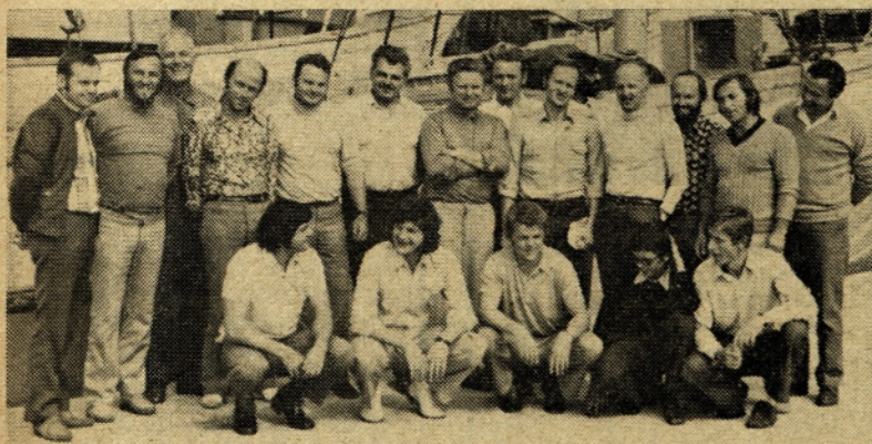
To so člani podvodnega krožka našega društva LT, ki so tudi letos v svoji dejavnosti dosegli lepe uspehe