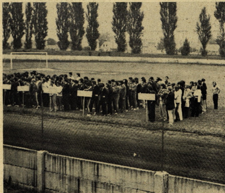
Tekmovalne ekipe so zbrane na otvoritvi mladinske olimpiade '72 v Mariboru. Vsaka ekipa je dobro pripravljena in upa na uspeh

Za prvo in drugo mesto v finalnem srečanju sta igrali ekipi RI-