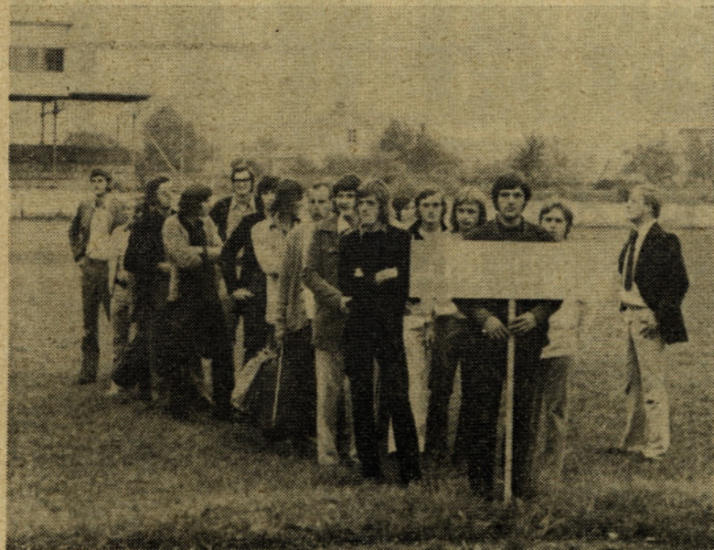
To je naša tekmovalna ekipa na mladinski olimpiadi '72, ki je priborila več zmag v hudi konkurenci

Del družbenega plana, in sicer proizvodni plan po količini in vrednosti za celo podjetje, plan celotnega dohodka, plan realizacije oziroma prodaje na domačem tržišču, plan izvoza s svojimi specifičnostmi, mora biti sprejet in potrjen s strani DS podjetja do konca meseca oktobra.