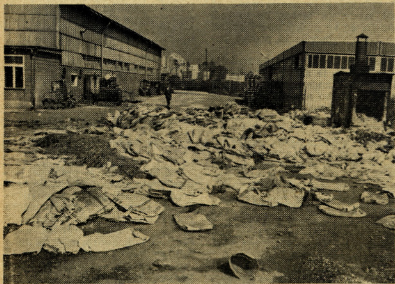
Topilec se jezijo, ker so jim nasuli to nesnago pred vrata. Kdor je to storil, je res velik pakec. Upajmo, da se bo našla metla, sicer bo postala tovarna pravc smetišče

Poudariti moramo, da gre za izenačevanje pravic iz zdravstvenega varstva, ne pa tudi ostalih pravic, ki jih imajo delavci v zdravstvenem zavarovanju. To se pravi, da zaenkrat ne bi imeli denarnih pravic iz zavarovanja. (Dalje na 4. strani)