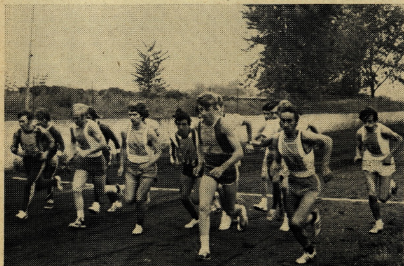
Otvoritveni tek na 1.700 m je bil sicer nekoliko razburljiv, vendar zelo uspešen. Tekmovalci so napeli vse sile in najbolj vzdržljivi so bili prvi na cilju