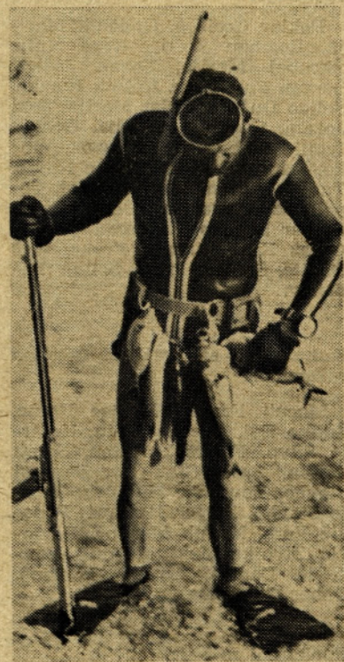
Ne, to ni »marovec«, temveč član podvodnega krožka naše LT v »bojni« opremi

Interesenti dobe vse informacije v ALU oddelku na interni tel. št. 426.